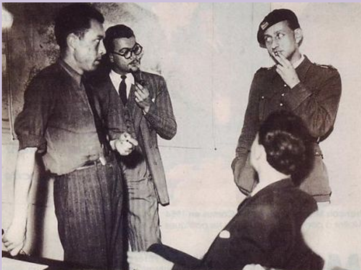
Albert Camus, Jacques Baumel, André Malraux à « Combat » en septembre 1944