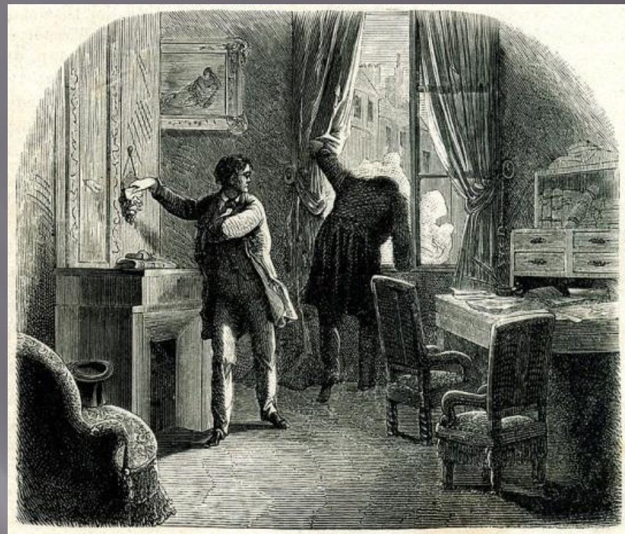
Иллюстрация к рассказу «Похищенное письмо»

Детектив и сыщик — не профессия Дюпена. Он просто читает разные газеты, делает выводы и берётся за дело. Он иногда советуется с полицейскими. Его главное оружие — это его ум и интеллект, с помощью которых Дюпен раскрывает тяжёлые загадки, которые полицейские считают неразрешимыми.