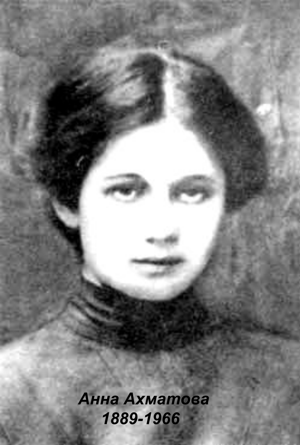
Анна Ахматова 1889-1966