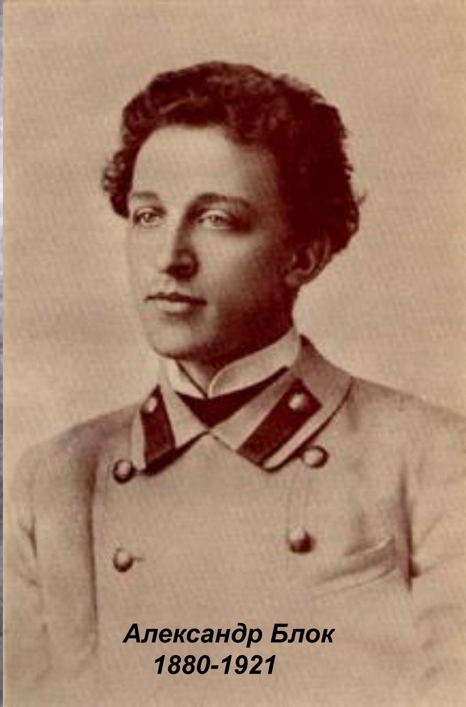
Александр Блок 1880-1921