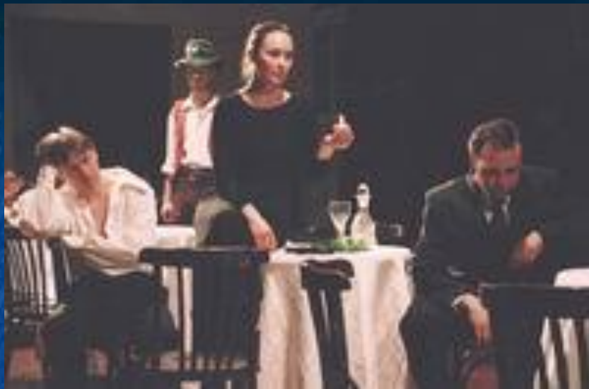
• Сцена из спектакля по пьесе «Бесприданница».