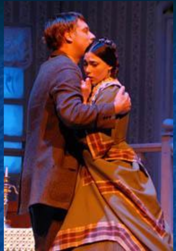
Сцена из пьесы А.Н. Островского «Бедность не порок».