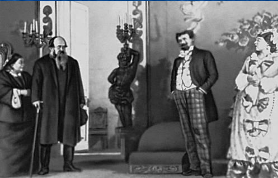
«Свои люди – сочтёмся!». Сцена из спектакля.