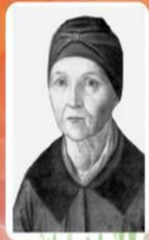
Няня Арина Родионовна