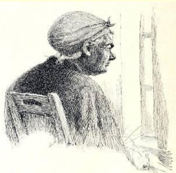
ИРИНА РОДИОНОВНА. Картина В. Маковского.