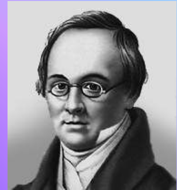
ДЕЛЬВИГ Антон Антонович (1798-1831), русский поэт. Друг А. С. Пушкина.

В 1829-30 ярым противником Пушкина и его круга стал редактор популярной газеты «Северная пчела» Ф. В. Булгарин, известный своим сотрудничеством с тайной полицией, сочетавший вражду к аристократии, эпигонское просветительство, торговую хватку, чудовищное хамство и умение доходчиво толковать с публикой.