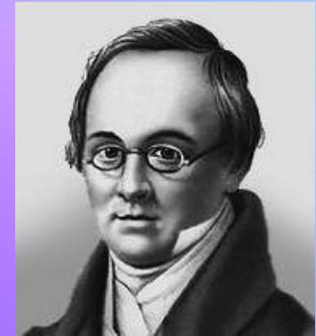
ДЕЛЬВИГ Антон Антонович (1798-1831), русский поэт. Друг А. С. Пушкина.

В 1829-30 ярым противником Пушкина и его круга стал редактор популярной газеты «Северная пчела» Ф. В. Булгарин, известный своим сотрудничеством с тайной полицией, сочетавший вражду к аристократии, эпигонское просветительство, торговую хватку, чудовищное хамство и умение доходчиво толковать с публикой.