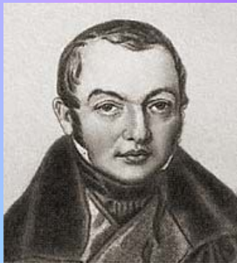
БУЛГАРИН Фаддей Венедиктович (1789-1859), русский журналист, писатель.

Сложности были и в «республике словесности»: Пушкин и его давние союзники (Вяземский, Дельвиг) не вполне сошлись с московскими любомудрами, отношения с Н. А. Полевым и Н. И. Надеждиным колебались от отчужденных до враждебных;