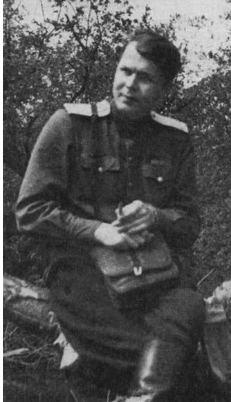
Александр Твардовский. 1945

«Василий Теркин — поистине редкая книга: какая свобода, какая чудесная удаль... и какой необыкновенный народный солдатский язык» (И.А.Бунин)