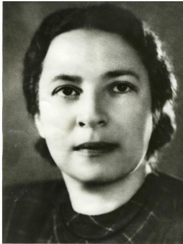
Агния Львовна Барто

Широкую известность получили художественные фильмы, поставленные по сценариям Агнии Барто: «Подкидыш» 1939 г., «Слон и верёвочка» 1946 г., «Алёша Птицын вырабатывает характер» 1953 г., «Десять тысяч мальчиков» 1963 г., «Чёрный котёнок» 1965г.