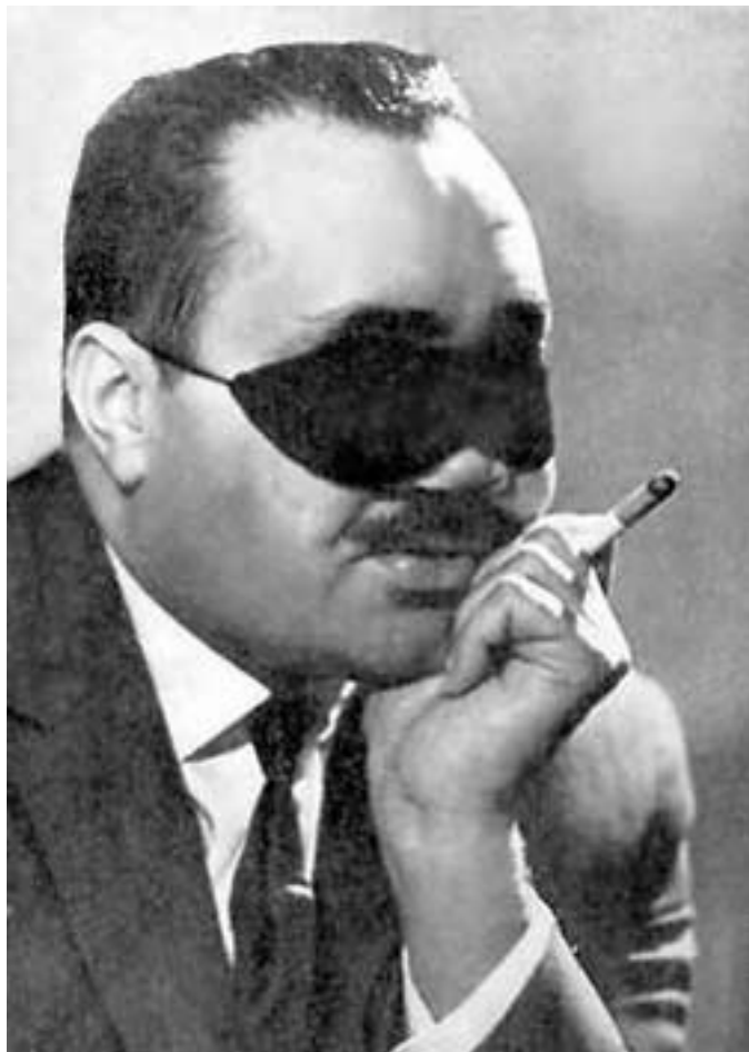
Эдуард Асадов (07.09.1923 – 21.04.2004)