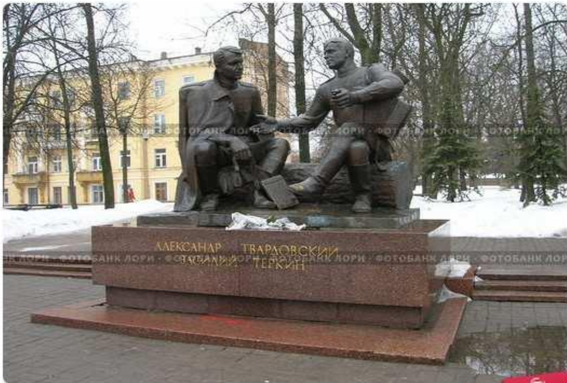
Смоленск. Памятник Александру Твардовскому и Василию Теркину.