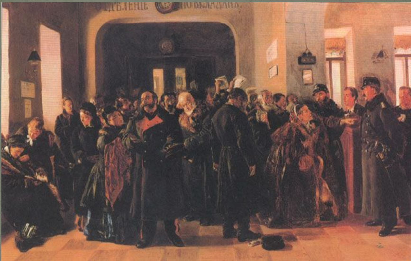
В. Маковский «Крах банка»