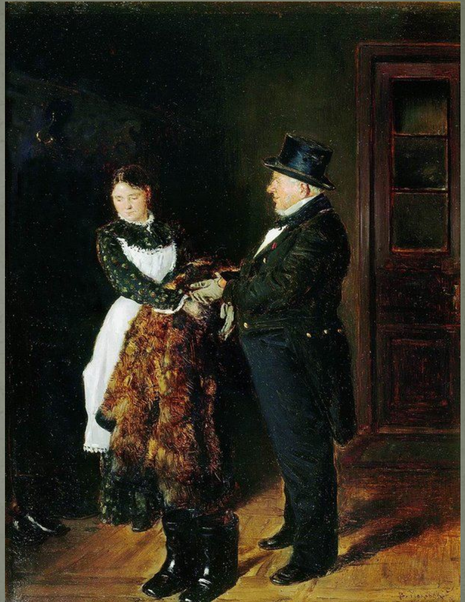
В. Маковский «В передней»