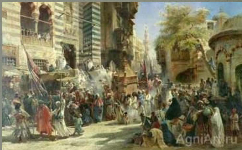
К. Маковский «возвращение священного ковра из Мекки в Каир»