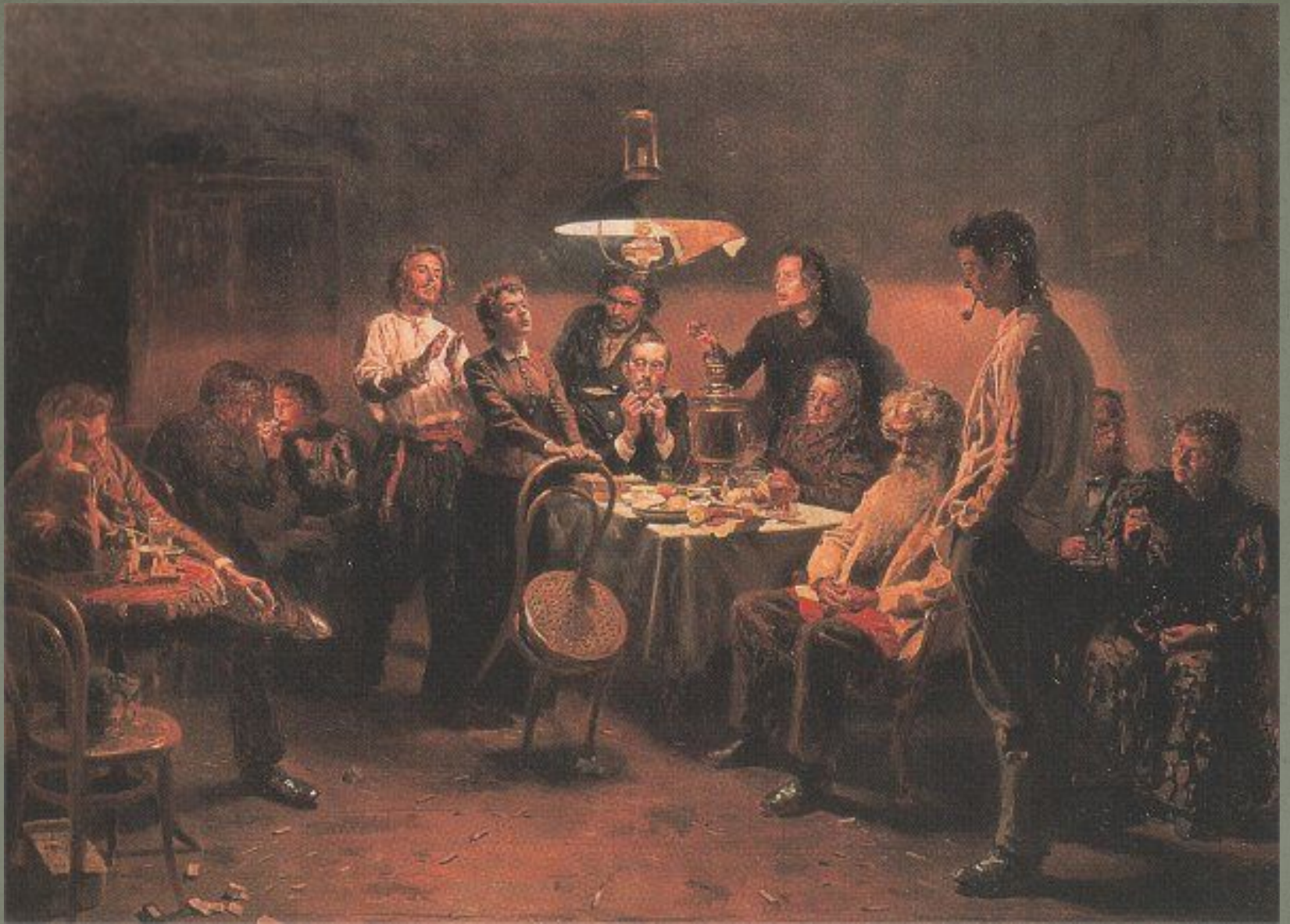
В. Маковский «Вечеринка»