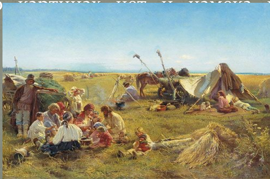
К. Маковский «Крестьянский обед в поле»