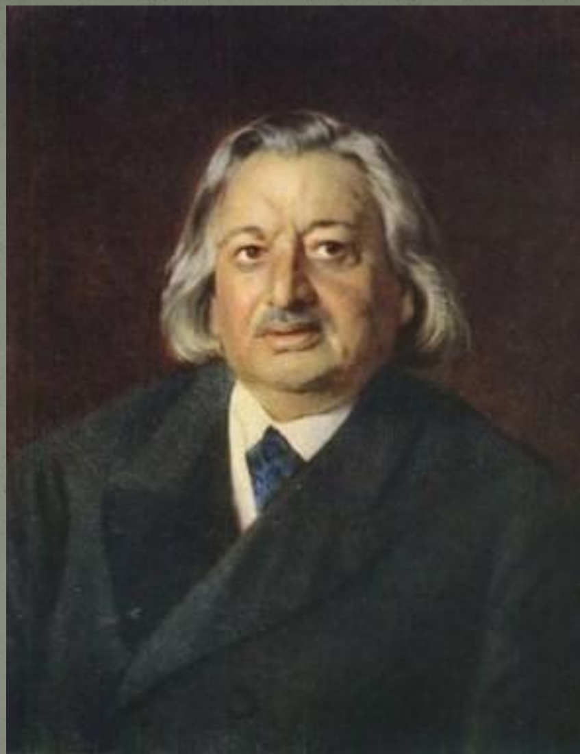
К. Маковский портрет оперного певца Петрова

В портретных работах мастер не отваживался слишком углубляться в духовный мир моделей. Но и у него есть удачи. Например, современники ценили портрет оперного артиста О. А. Петрова. Черты его характера поняты и бережно перенесены на полотно. Перед нами милый и обаятельный человек, знаменитость, любимец публики. И всё же он таков, каким был в кругу поклонников, а не наедине с собой.