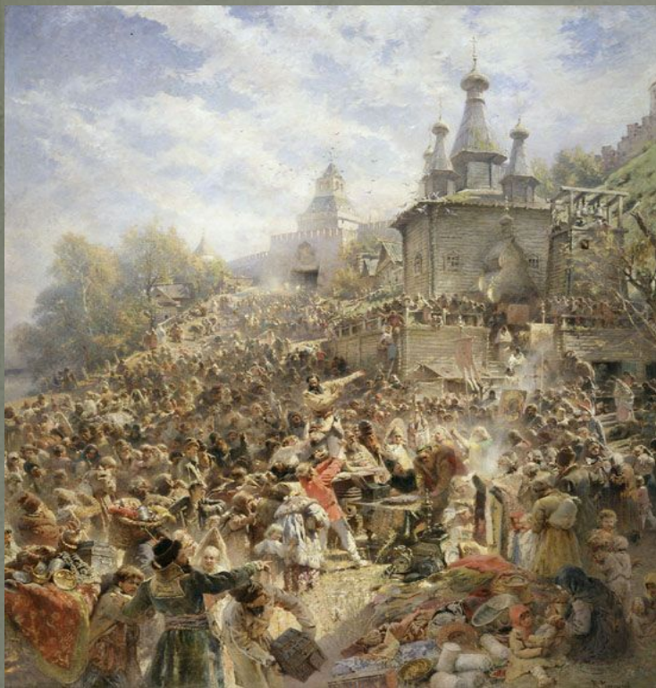
К. Маковский «Воззвание Минина»