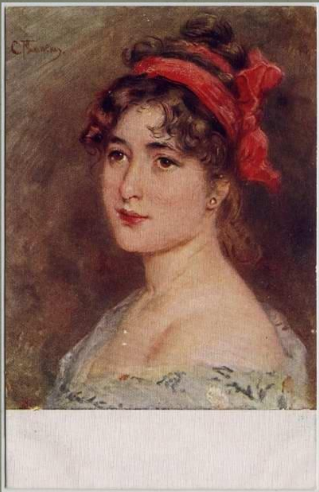
Маковский К. Е. «Головка»

По-разному сложились их творческие судьбы. С давних пор принято считать, что первый из них – блестящий живописец, разменявший свой дар на художественные поделки. «Константин Маковский держал себя большим барином, ходил, чуть ли не в боярском костюме, выдерживал тон большого, знатного артиста. Зарабатывал большие деньги и умел их проживать. Писал в угоду большой буржуазной публике сладкие ложнорусские сцены, а также бесконечные головки боярышень и в конце стал типичным поставщиком художественного рынка», - утверждал Я. Минченков. Но это не так.