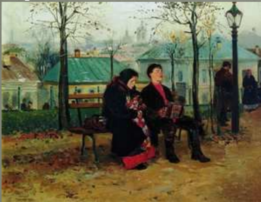
В. Маковский «На бульваре»