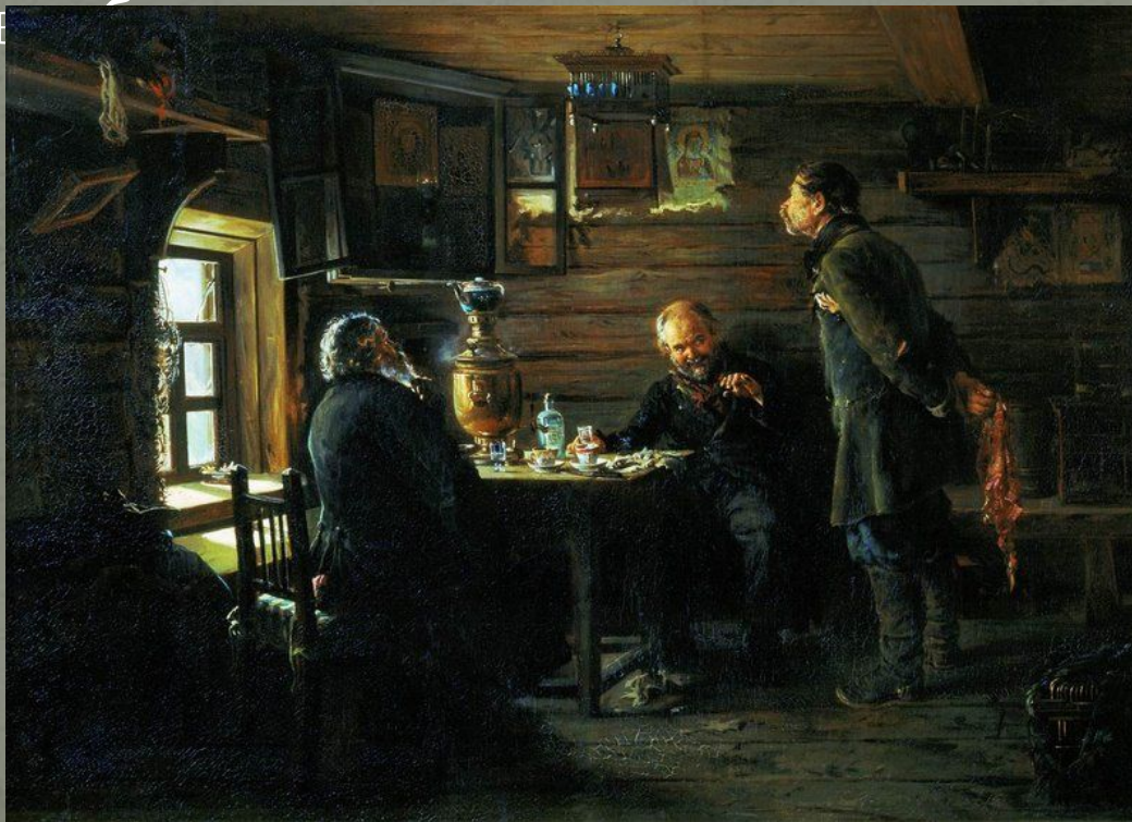
В. Маковский «Любители соловьёв»