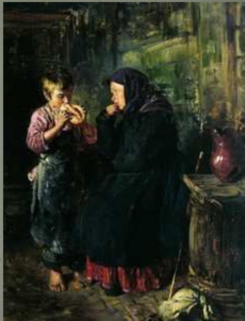
В. Маковский «Свидание»