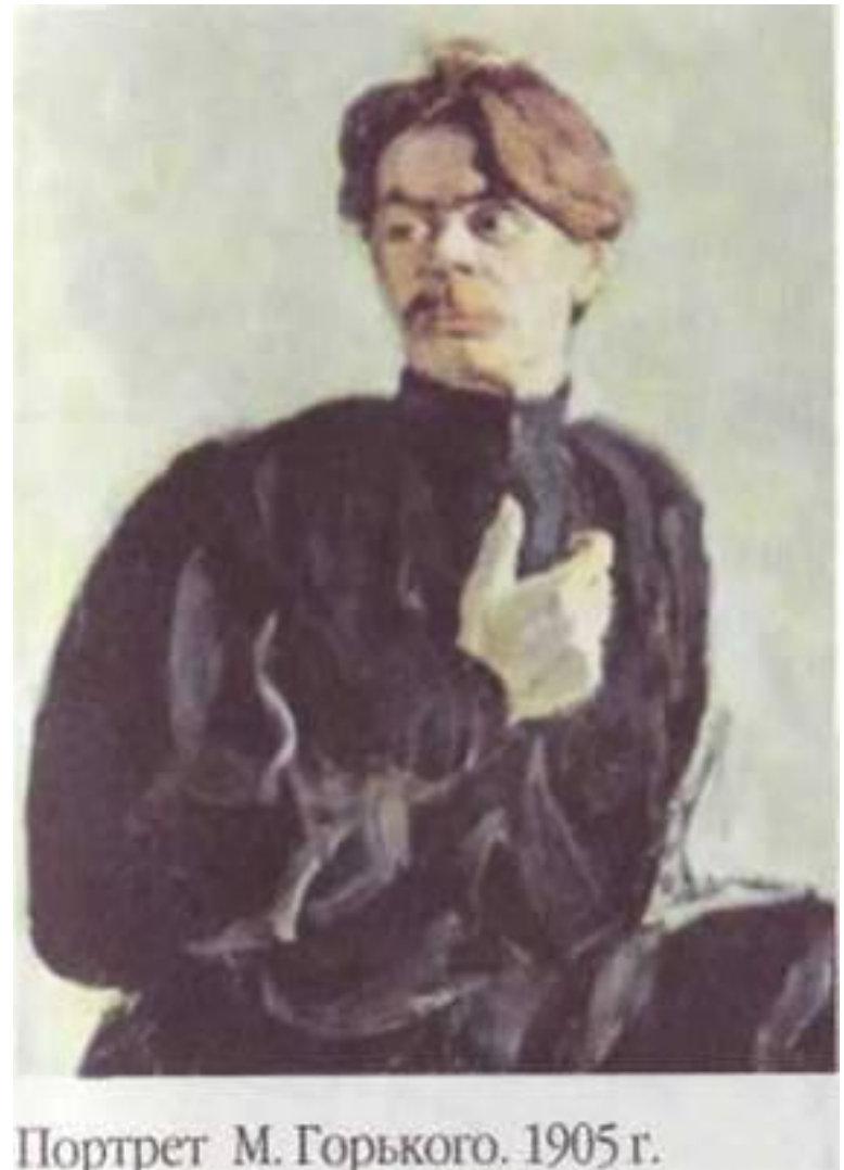
Портрет М. Горького. 1905 г.

Жизнь молодого Алеши Пешкова «в людях» была горькой и писал он про горькую участь обездоленных... И этот символический псевдоним впервые появился под рассказом «Макар Чудра», в Тифлисе, газете «Кавказ»