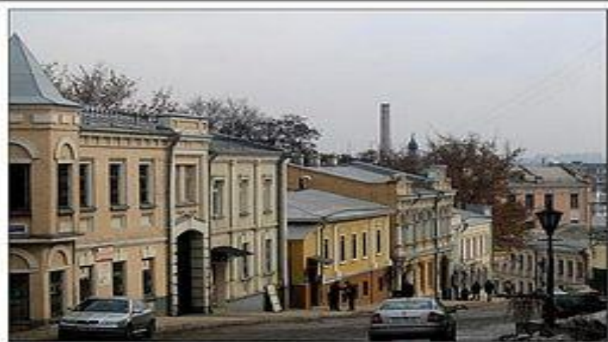
Киев, Андреевский спуск