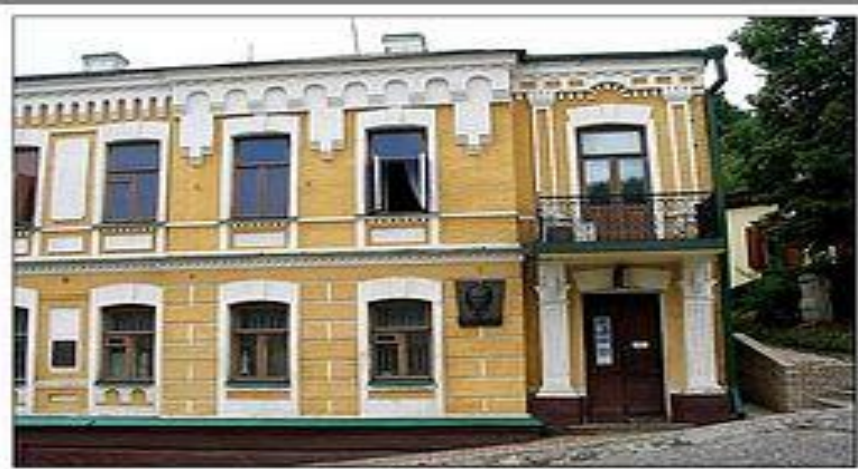
Андреевский спуск, 13. Дом-музей М.А.Булгакова (известен также как дом Турбиных по роману "Белая гвардия")

(до недавнего времени был достопримечательностью Киева и Андреевского спуска)