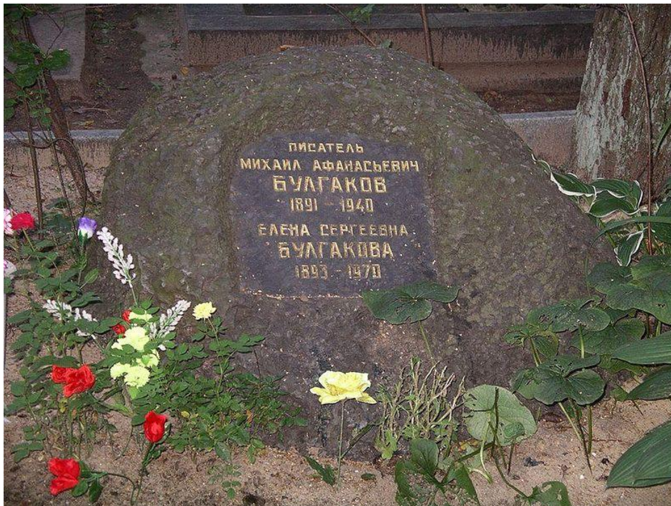
Камень с могилы Н. Гоголя на могиле М. Булгакова