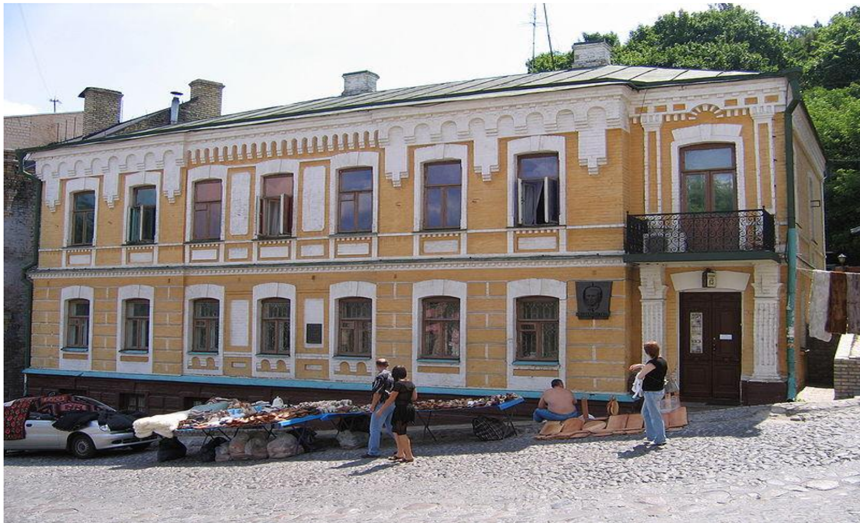
Дом Булгакова в Киеве