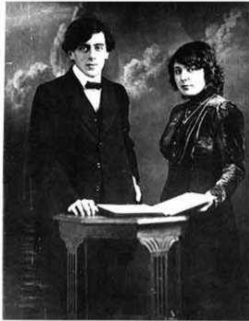
Сергей Эфрон и Марина Цветаева незадолго до свадьбы. 1911 год.