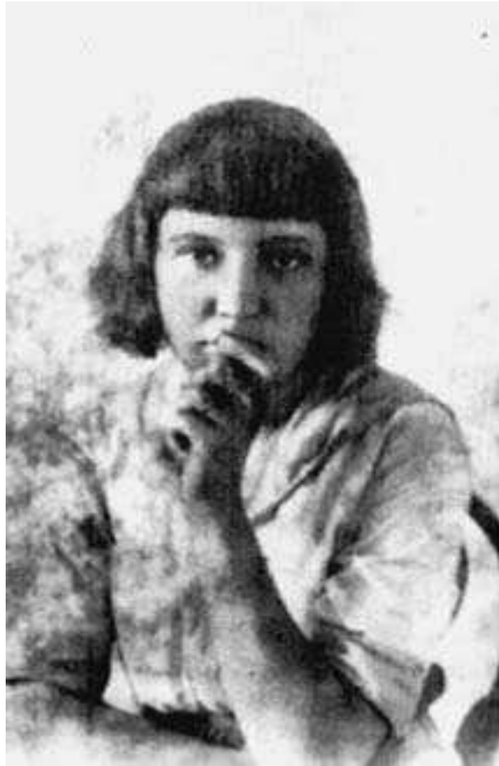
М.Цветаева 1913 г.