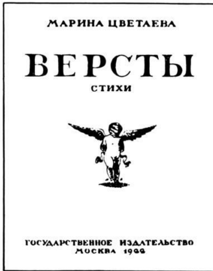
М. И. Цветаева. «Версты». Обложка работы Н. Н. Вышеславцева