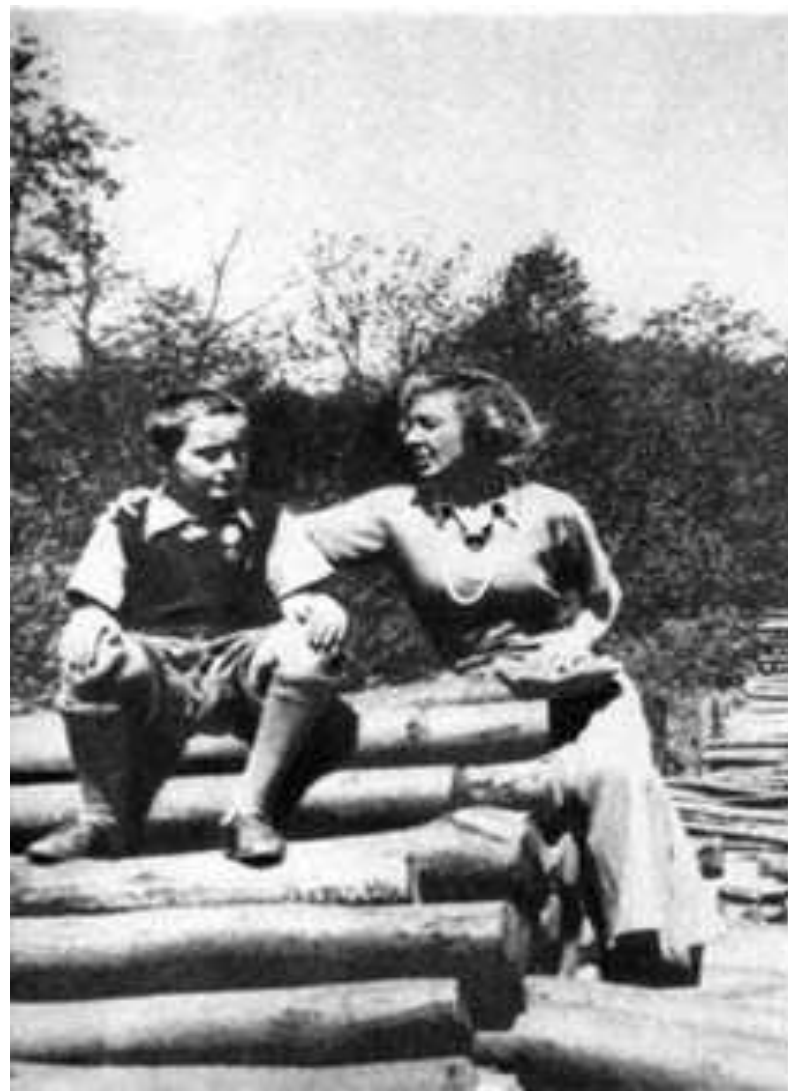
М. Цветаева с сыном Георгием