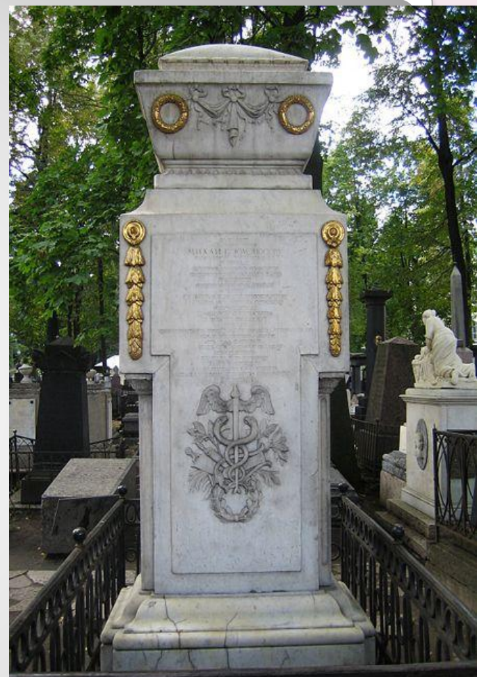
Могила М.В.Ломоносова в Александро – Невской лавре

Я знак бессмертия себе воздвигнул Превыше пирамид и крепче меди, Что бурный Аквилон сотреть не может Ни множество веков, ни една древность. Не вовсе я умру, но смерть оставит Велику часть мою, как жизнь скончаю. Я буду возрастать повсюду славой, Пока великий Рим владеет светом.