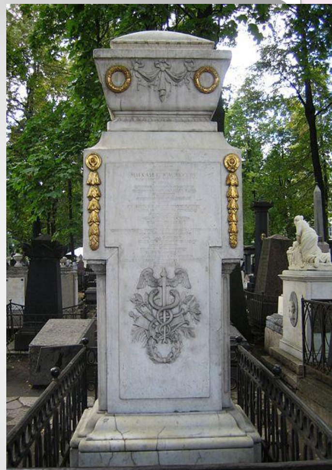
Могила М.В.Ломоносова в Александро – Невской лавре

Я знак бессмертия себе воздвигнул Превыше пирамид и крепче меди, Что бурный Аквилон сотреть не может Ни множество веков, ни една древность. Не вовсе я умру, но смерть оставит Велику часть мою, как жизнь скончаю. Я буду возрастать повсюду славой, Пока великий Рим владеет светом.