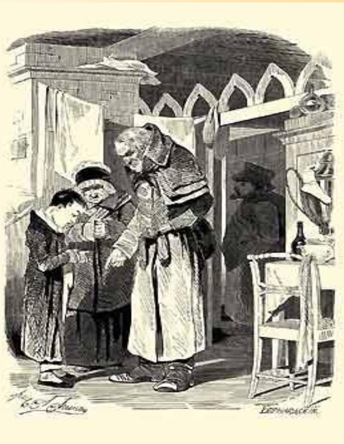
Детство Чичикова. Отъезд в школу.

Причину омертвления души человека Гоголь показывает на примере формирования характера главного героя — Чичикова .