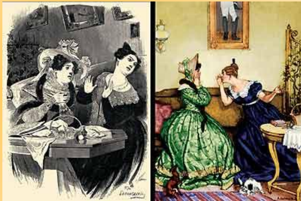
Дамы города NN