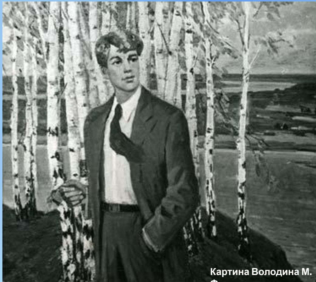
Картина Володина М. Ф.

С самого детства поэт впитал в себя дух и красоту родной природы.