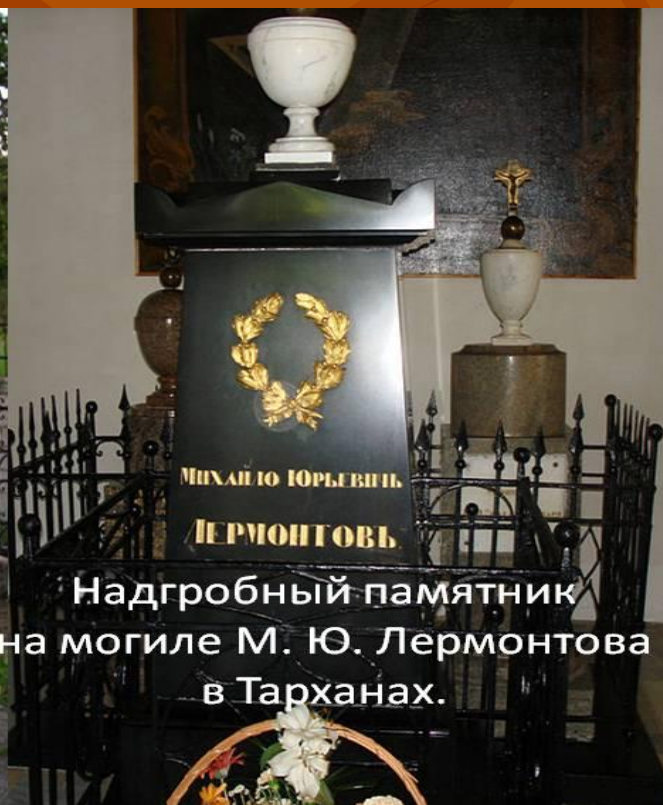
Надгробный памятник на могиле М. Ю. Лермонтова в Тарханах.