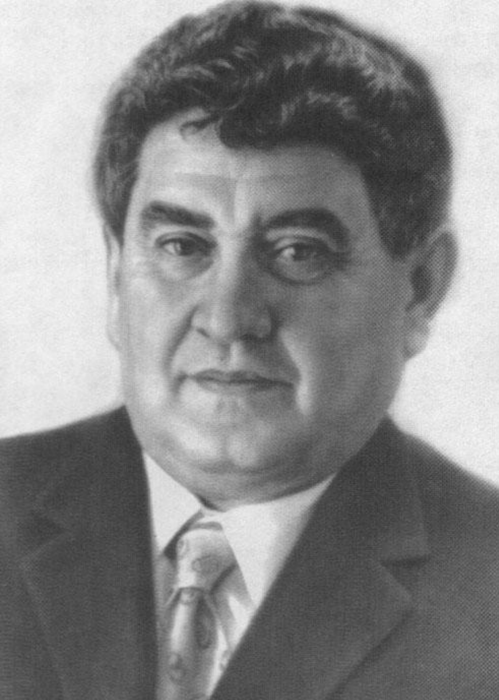
Виктор Драгунски й