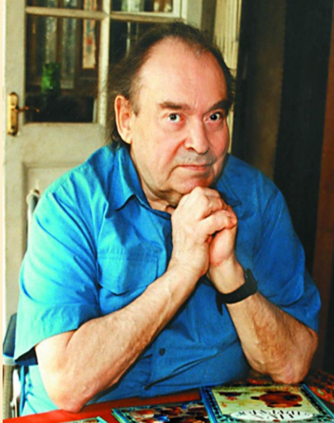
Борис Заходер (1918-2000 гг.)