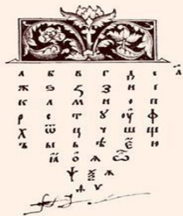
Первый русский букварь. 1574.