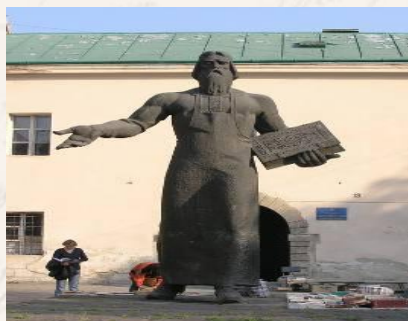
Памятник И. Фёдорову. Первая книга И. Фёдорова "Апостол". Львов 1564