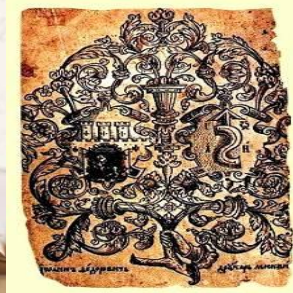
Книжный знак И. Фёдорова