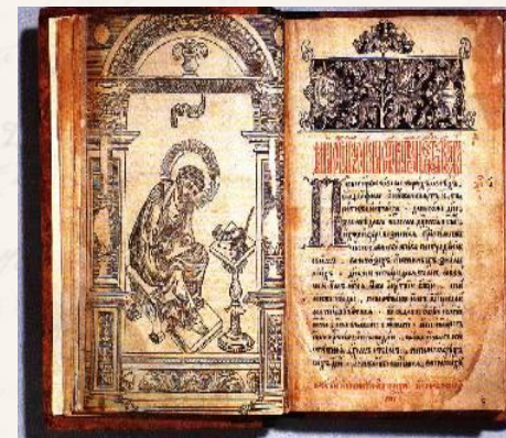
Фронтиспис первой печатной книги." Апостол". 1564.