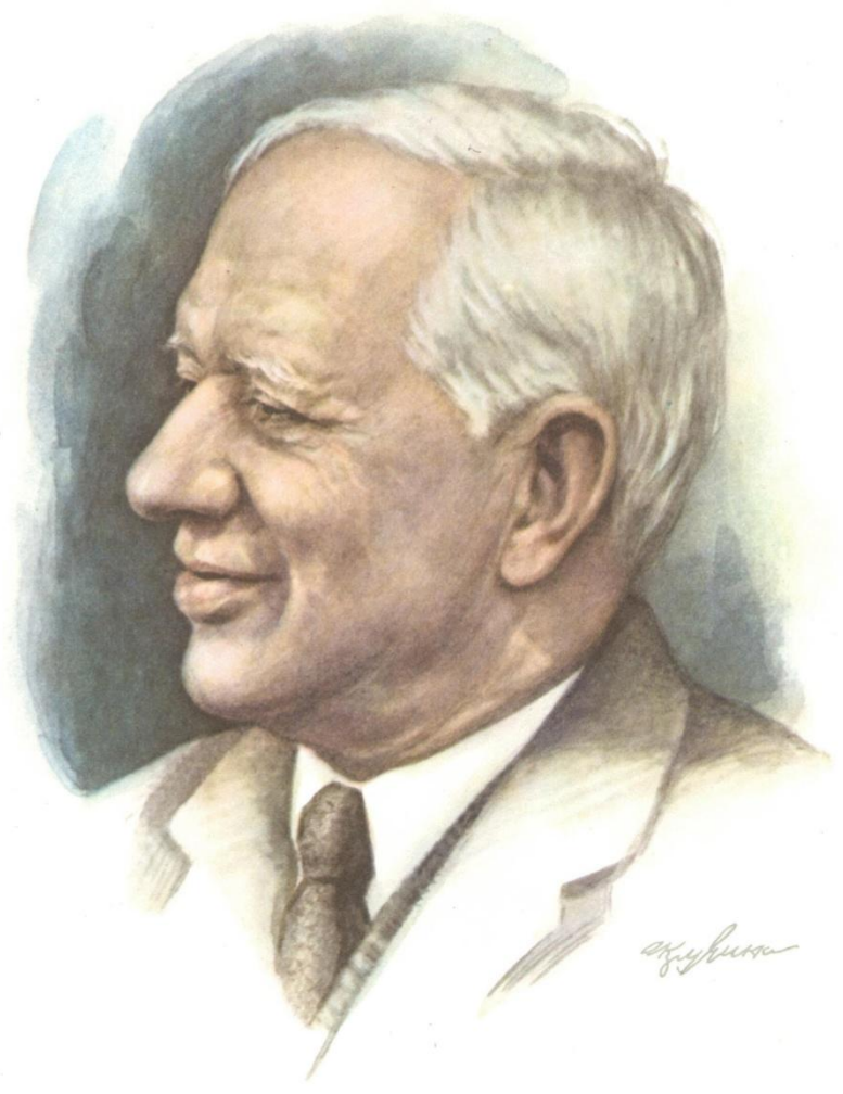
Корней Иванович Чуковский (1882—1969)