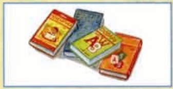
Книги, справочники, энциклопедии