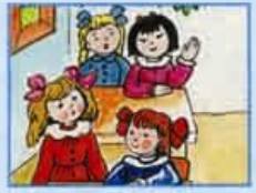
Сообщения об учёных и их изобретениях