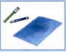
Сочинения «Самая интересная наука»