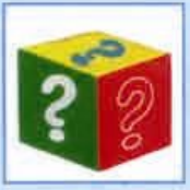
Придумай свой проект