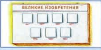
Стенд или фотоальбом