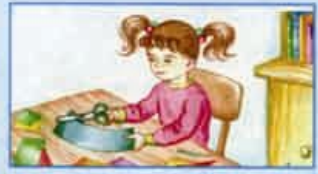
Выставка творческих работ