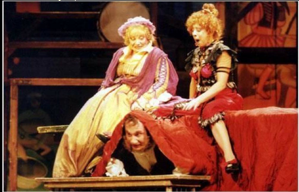
Эпизоды из «Зимней сказки» и «Бури»