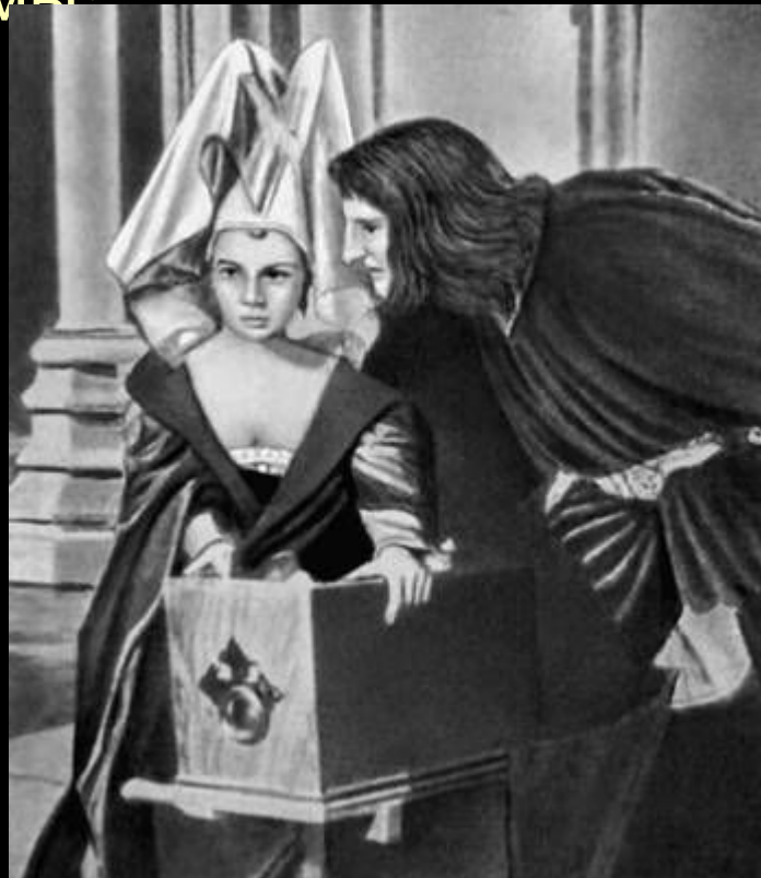
Эпизод из «Ричарда III»