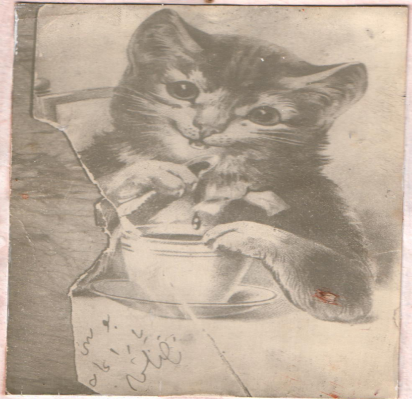
ПАДИ ТАКТАШНЫҢ Ф. КӘРИМ ГӘ БИРГӘН ОТКРЫТКАСЫ ОТКРЫТКА ПОДАРЕННАЯ Ф. КАРИМУ ПАДИ ТАКТАШЕМ