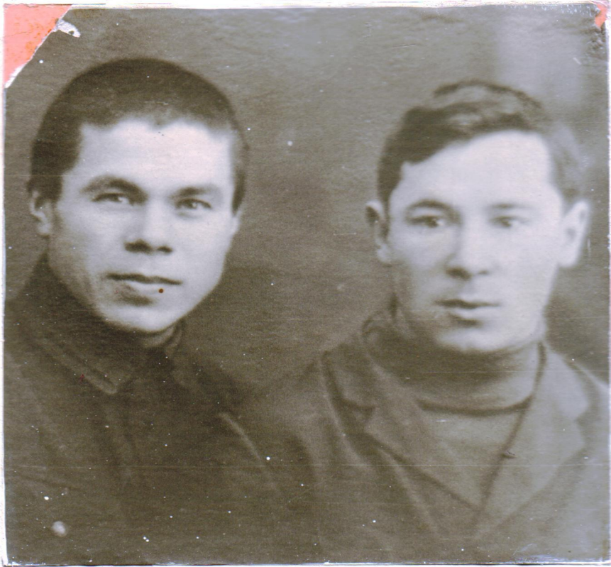
Ф. КӘРИМ МУСА ЖӘЛИЛ БЕЛӘН КАЗАН 1929 ЕЛ