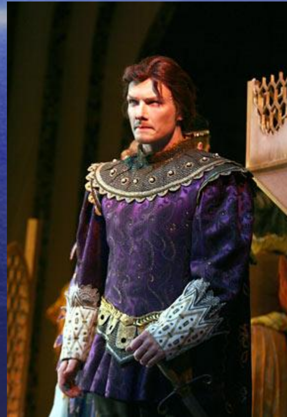
Из спектакля «Ундина»