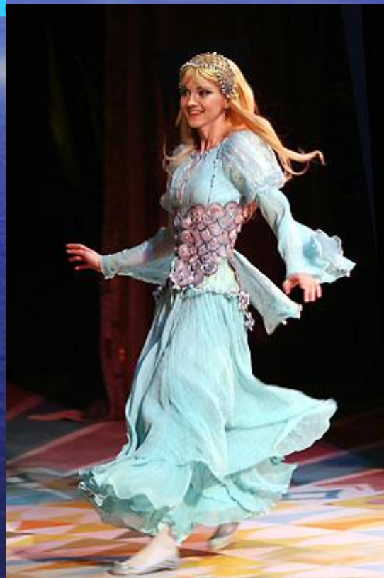
Из спектакля «Ундина»