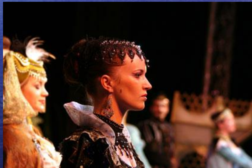
Из спектакля «Ундина»