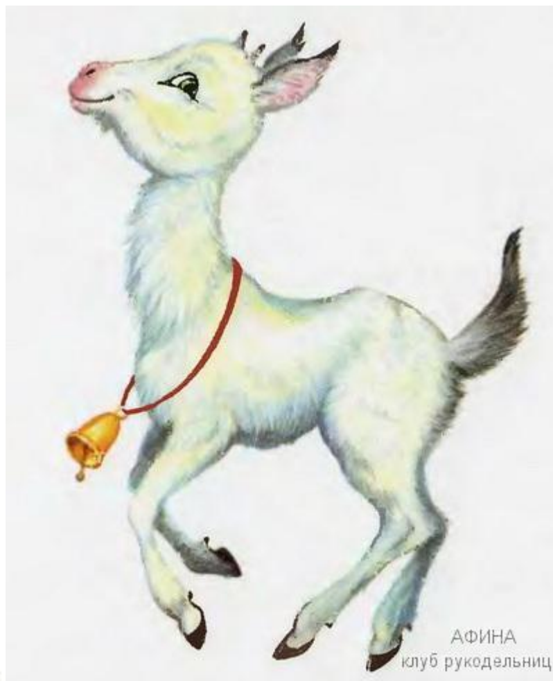
АФИНА клуб рукодельниц