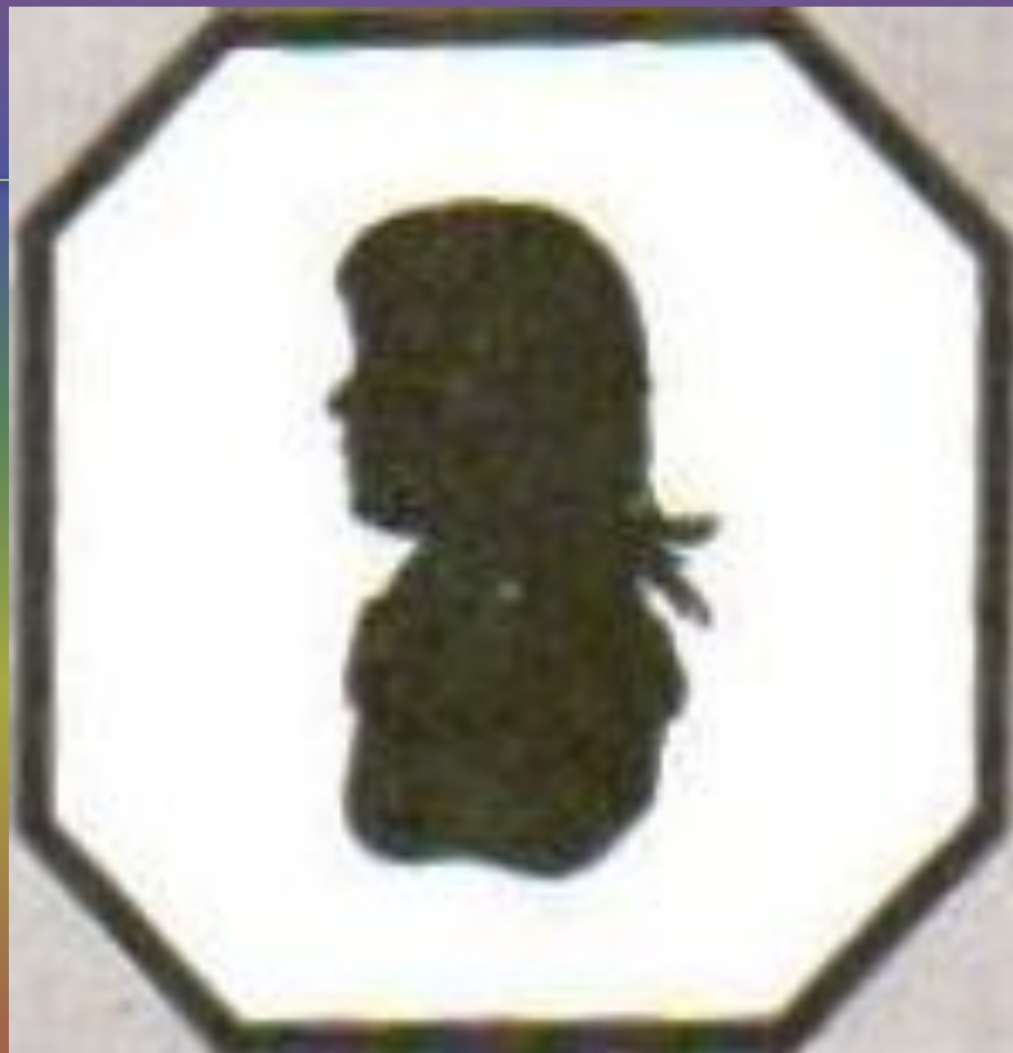
Мария Николаевна Волконская в детстве, мать Л.Н.Толстого.