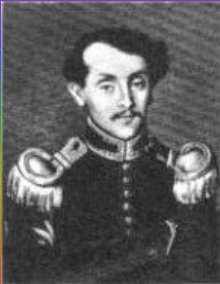
Николай Ильич, отец Л.Н.Толстого