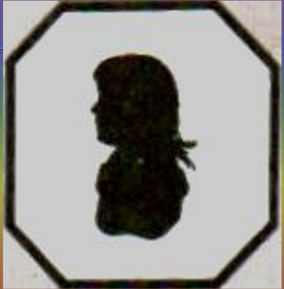
Мария Николаевна Волконская в детстве, мать Л.Н.Толстого.