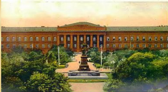
Николаевский зорь и Университетъ. Селманъ Старобинскъ А.Роснеръ. Киевъ. Е.Полвановичъ. 1905.