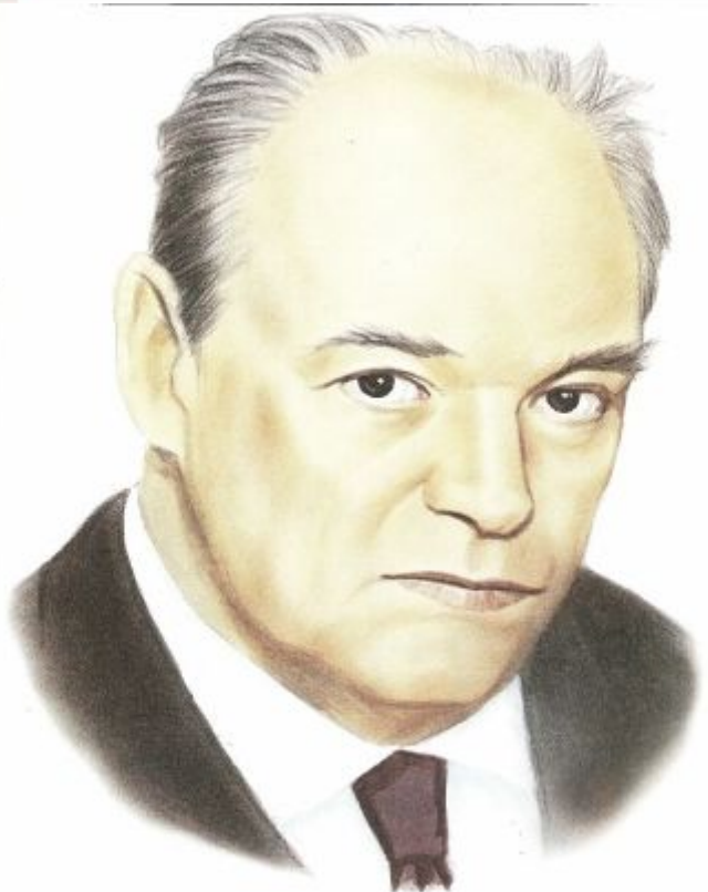
Чарушин Евгений Иванович (1901-1965)