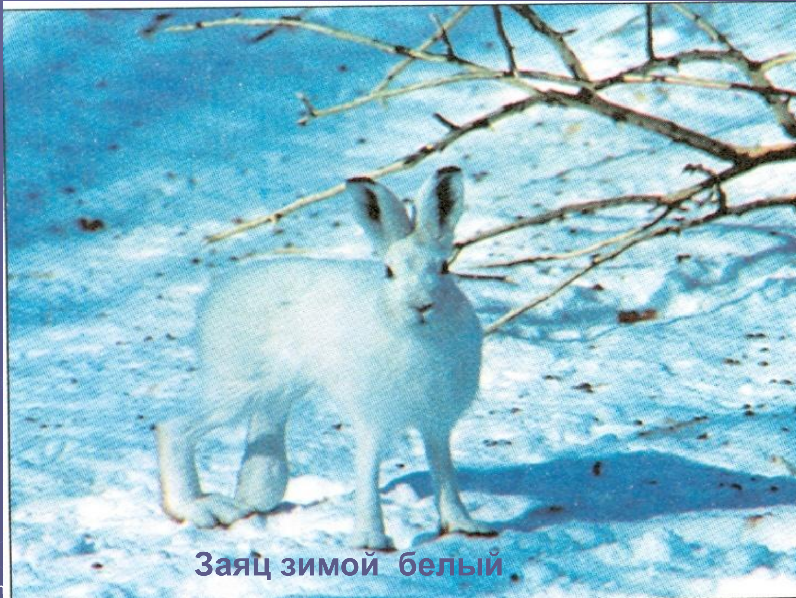
Заяц зимой белый