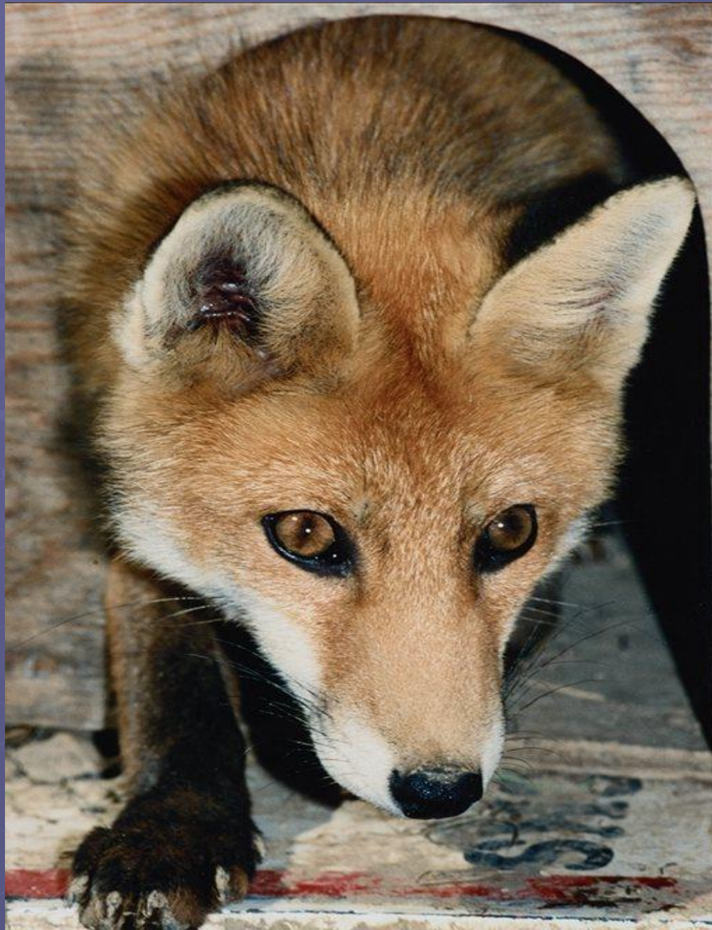
Лиса на охоте