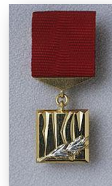
Премия Ленинского комсомола