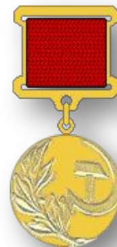
Государственная премия СССР