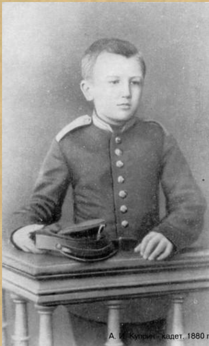
А. И. Куприн - кадет. 1880 г.

В 1876 году из-за тяжелого материального положения Любовь Алексеевна была вынуждена отдать сына в сиротское училище. Семилетний мальчик надел первую в своей жизни форму - парусиновые панталоны и парусиновую рубашку, обшитую вокруг ворота и вокруг рукавов форменной кумачовой лентой". Казенная обстановка причиняла мальчику жестокие страдания.