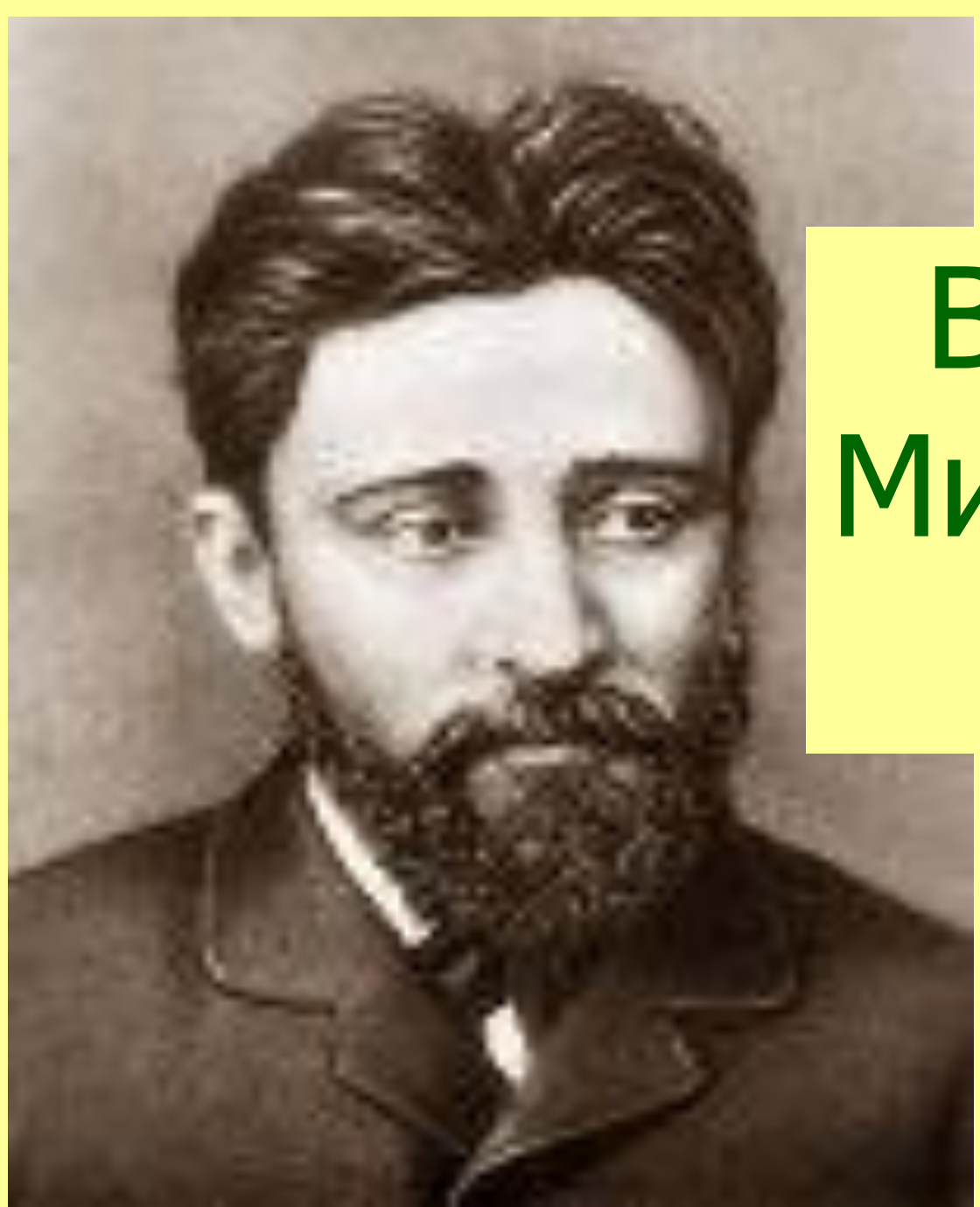
Всеволод Михайлович Гаршин