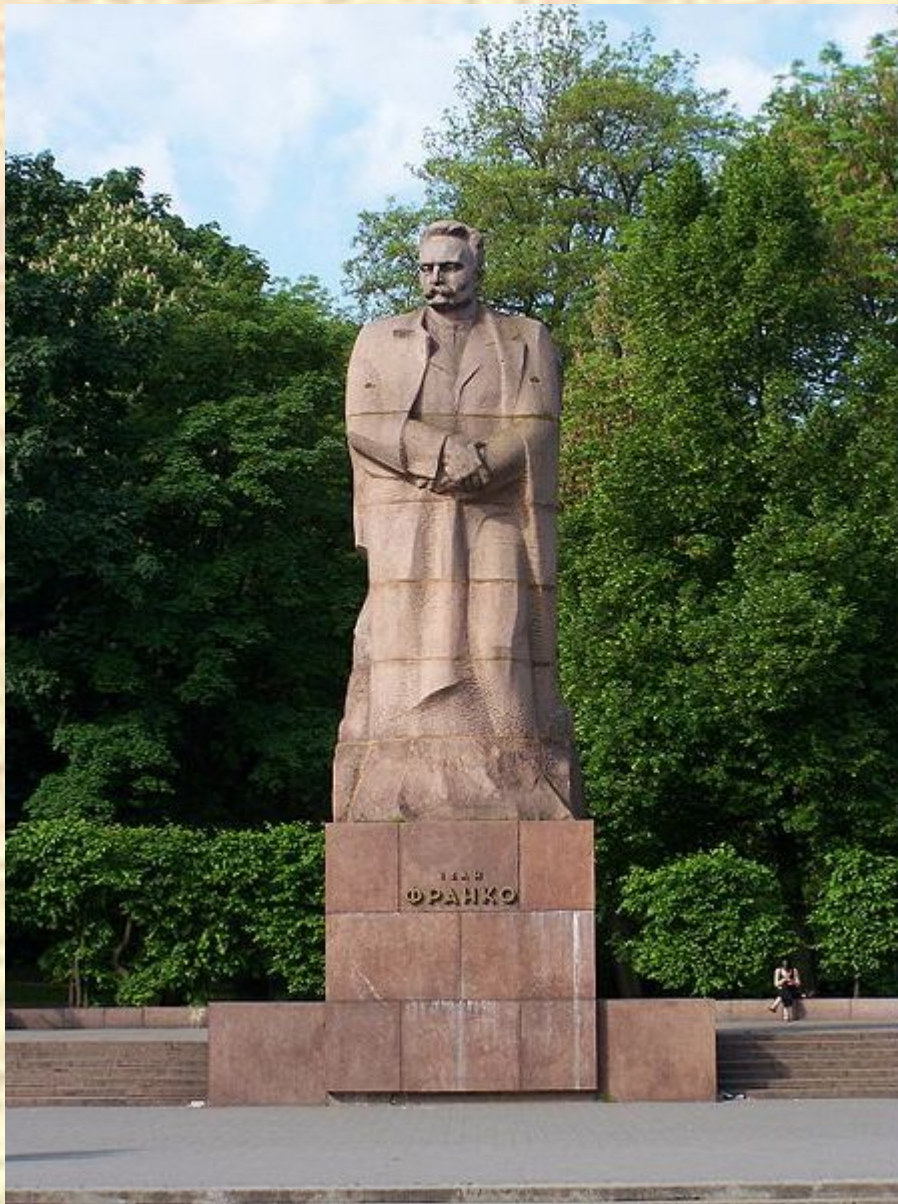
В 1964 году во Львове открыт памятник Ивану Франко.