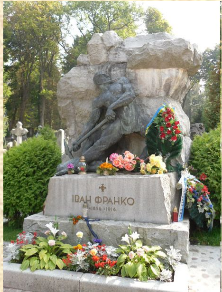
Могила И. Франко