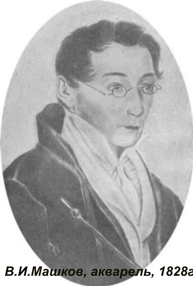
В.И.Машков, акварель, 1828г.