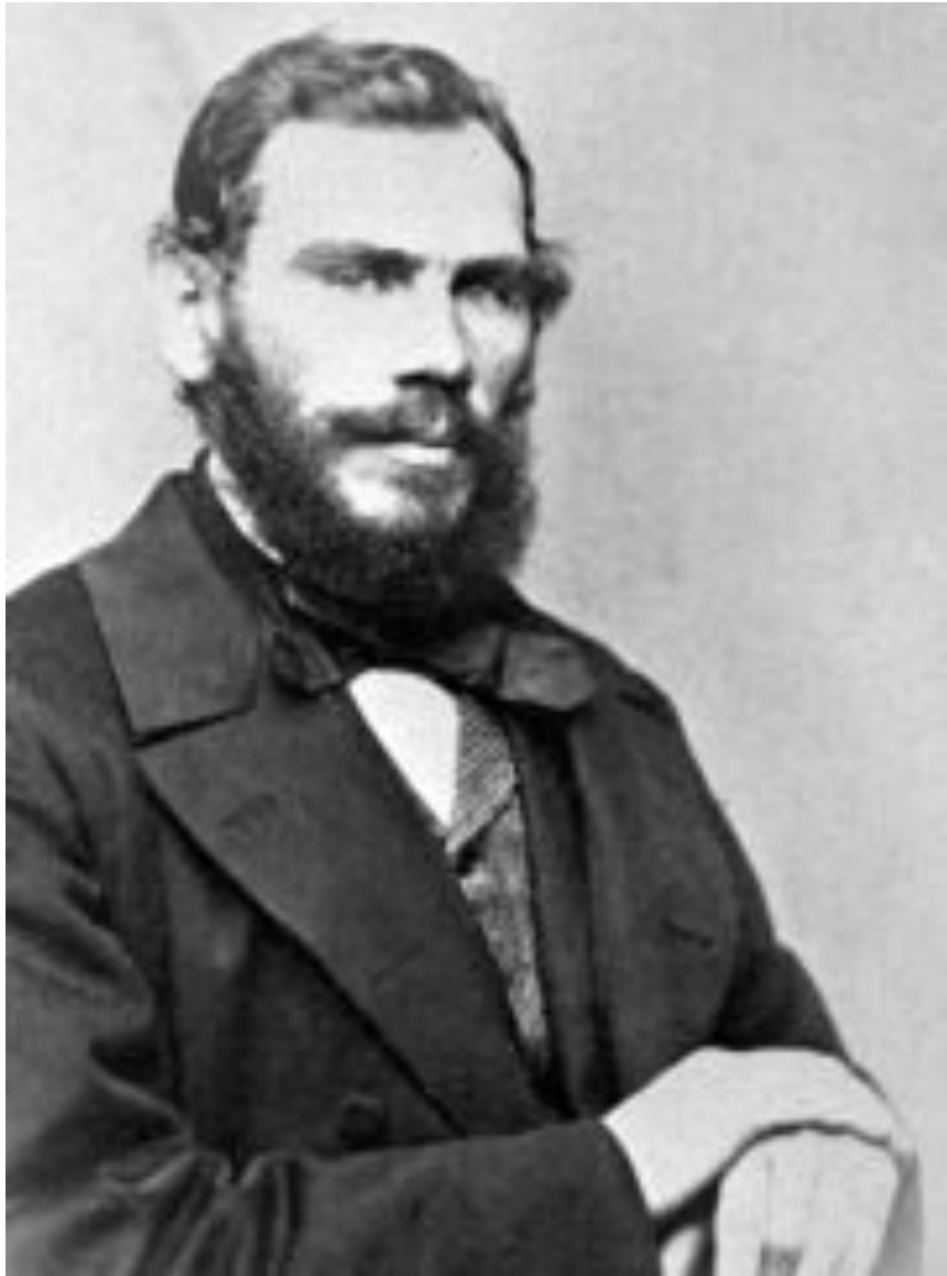
Лев Николаевич Толстой 1828-1910