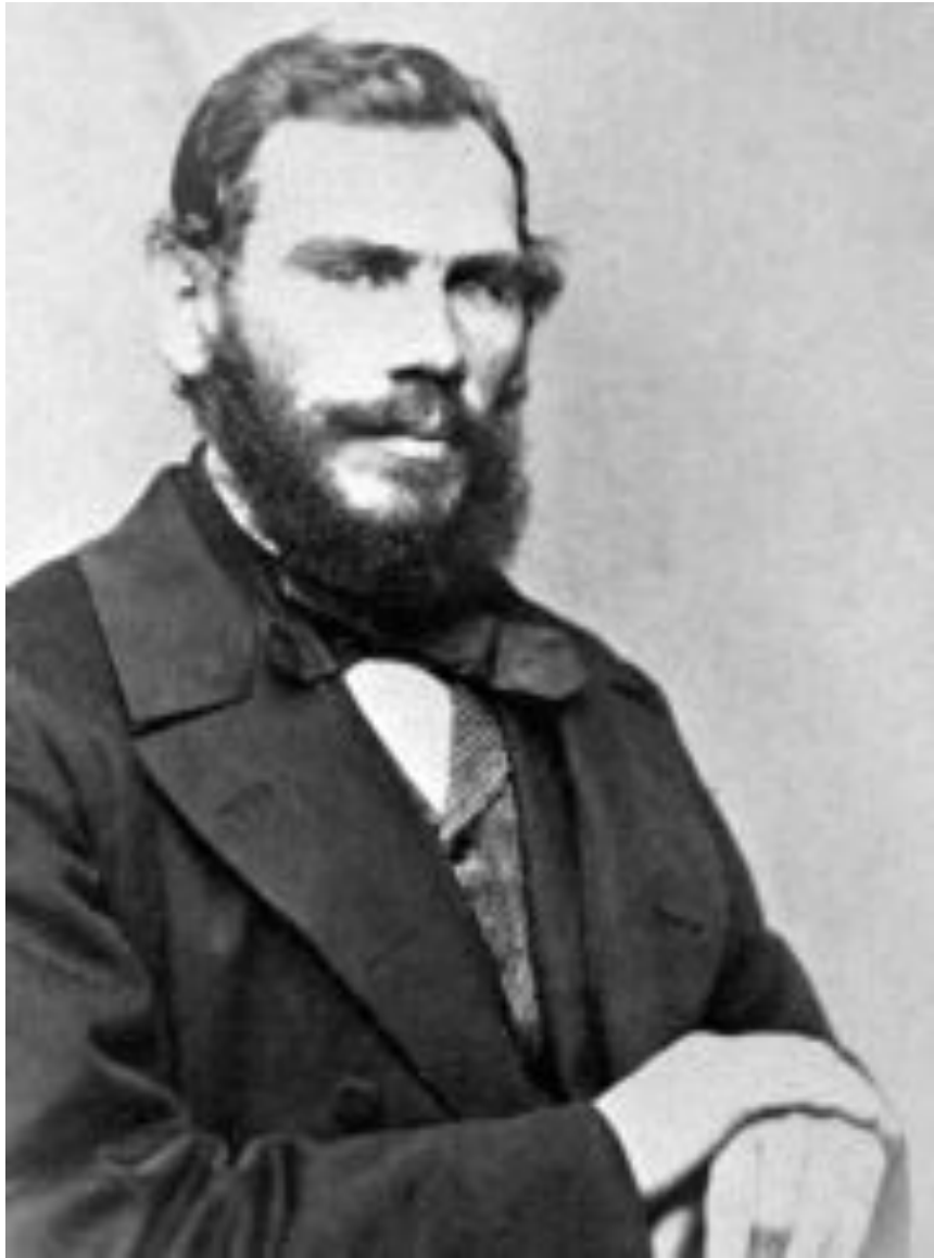
Лев Николаевич Толстой 1828-1910