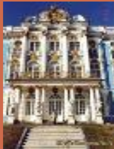
Пушкинский лицей и Екатерининский дворец.