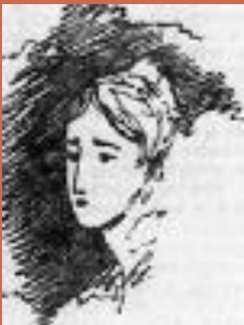
Н.Н. Гончарова на полях рукописи.