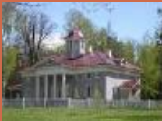
Музей Пушкина в Захарово