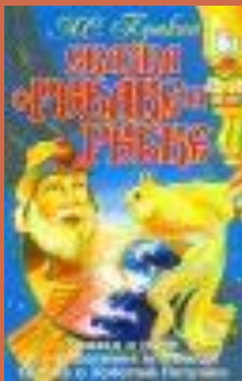
Сказка о рыбаке и рыбке