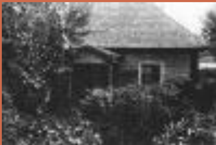
Дом Арины Родионовны в Михайловском