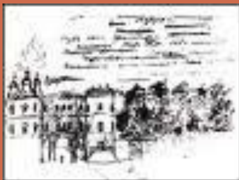
Рисунок к Евгению Онегину