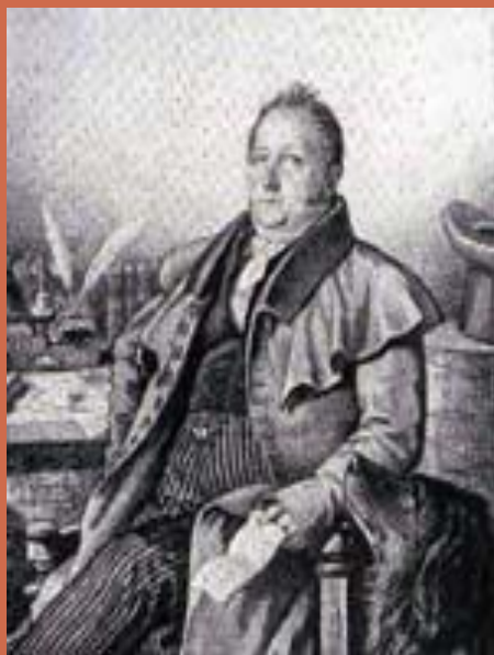
Пушкин Сергей Львович