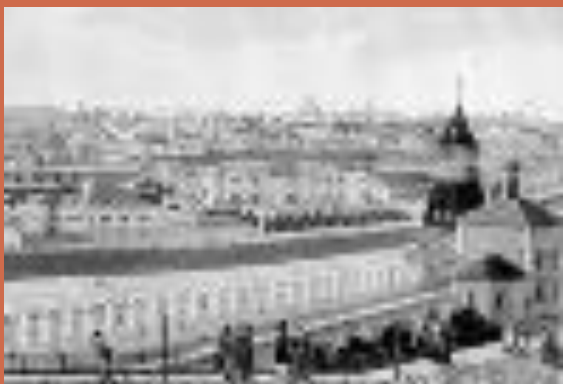
Вид с Кремлёвской стены I половины XIX века.