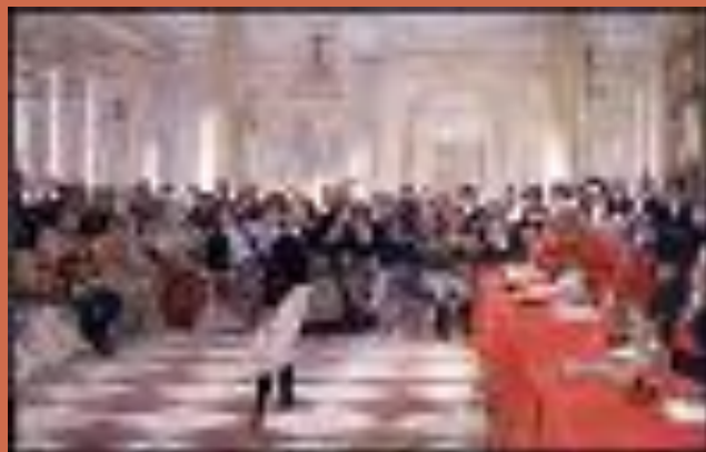
Пушкин на экзамене в Царском Селе 8 января 1815 года