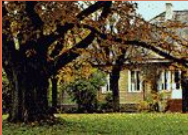
Музей Пушкина в Михайловском