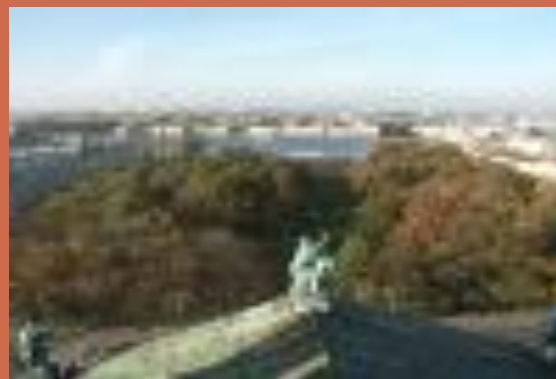
Нева с просмотровой площадки Исаакиевского Собора