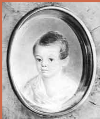
Пушкин в детстве