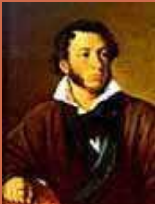
Портрет А.С. Пушкина художника Тропинина