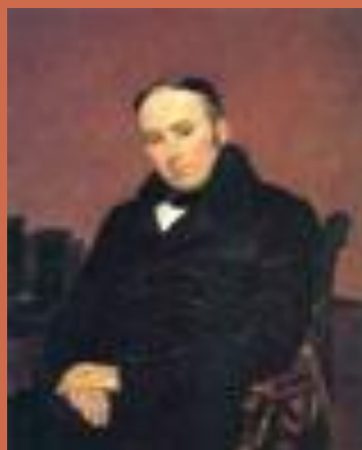
Жуковский В. А.