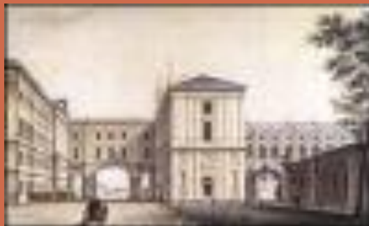
Лицей в 1824 году.