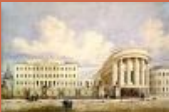
Старое здание университета