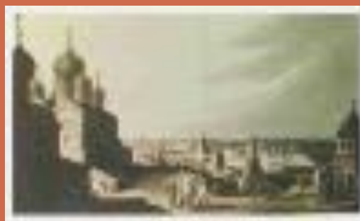
Москва в 1815 году на картине неизвестного художника.