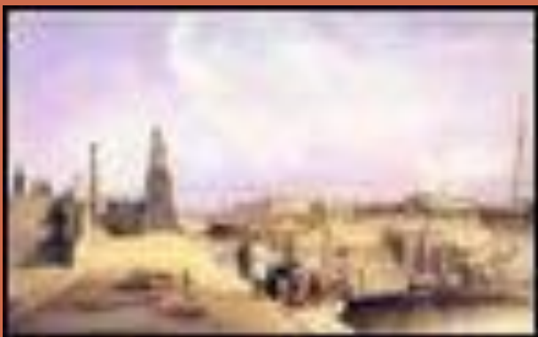
Вид Невы в 1841 году с парадной лестницы Академии художеств