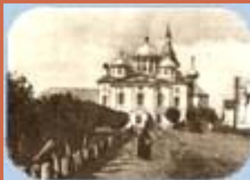
Московско-Петербуржский тракт с видом на Троицкий собор.