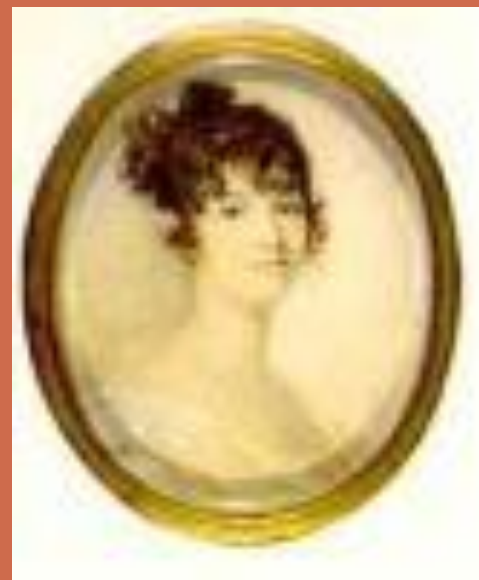
Пушкина Надежда Осиповна