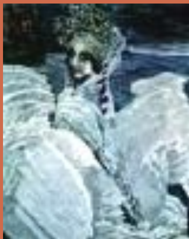
Царевна - Лебедь