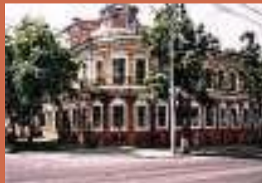
Библиотека им. Пушкина в г. Пермь