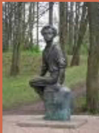
Памятник Пушкину в Захарово