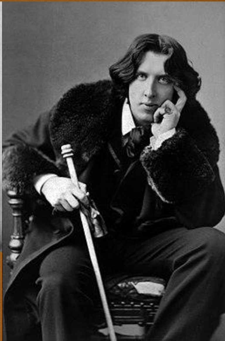
Оскар Уайльд 16 октября 1854 года, Дублин — 30 ноября 1900 года, Париж)