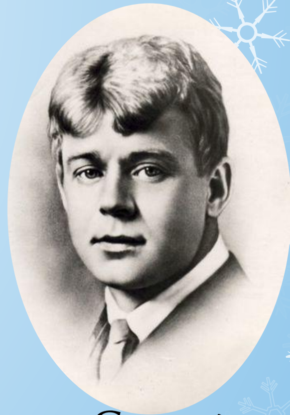
Сергей Есенин (1895-1925)