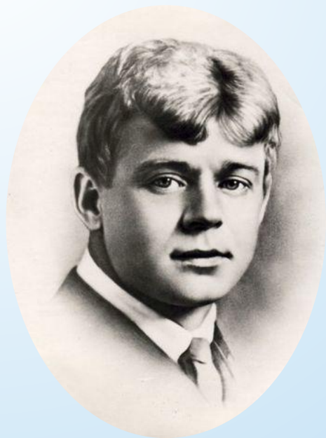
С.Есенин «Бабушкины сказки»