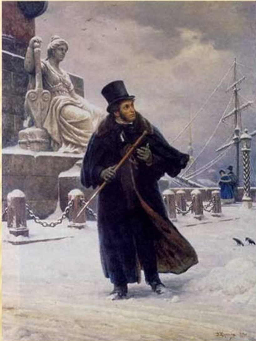
А.С.Пушкин в Петербурге. Худ. Б.В.Щербаков, 1949 г.