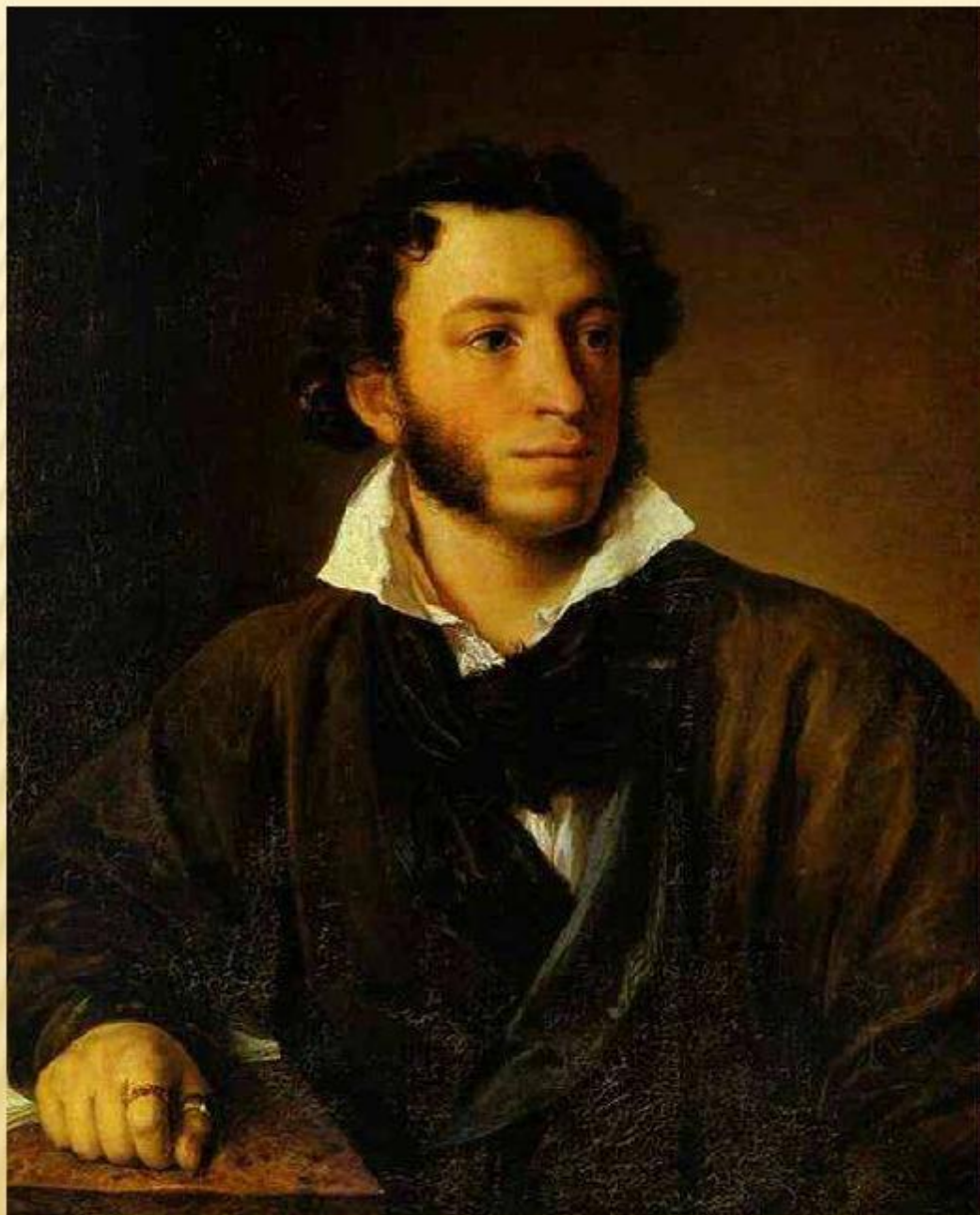
Александр Сергеевич Пушкин 1799-1837