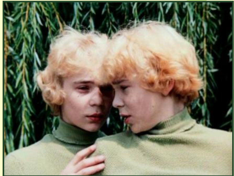
Электроник и Серёжа Сыроежкин