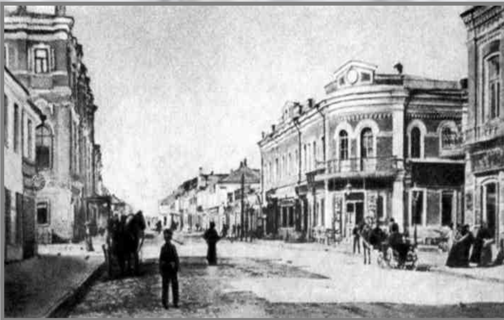
Елец, торговая улица