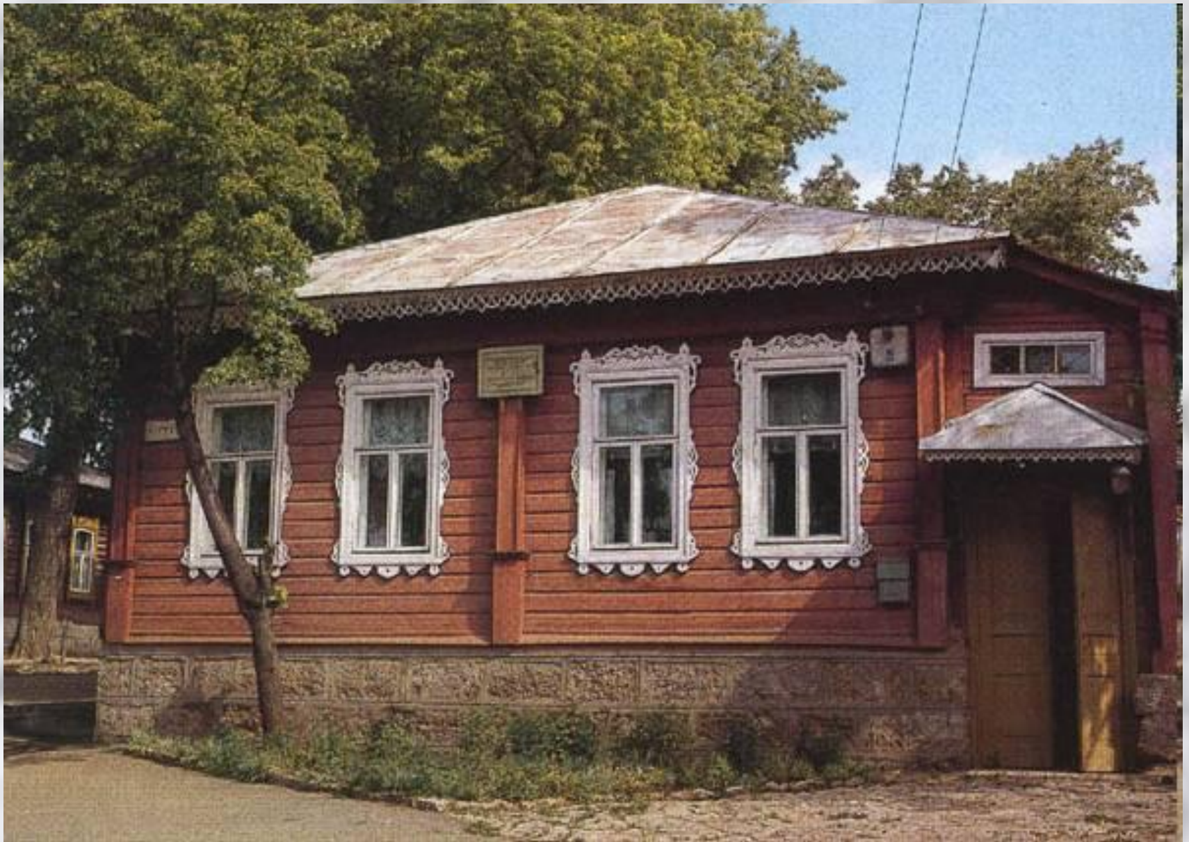
Домик-музей И.А. Бунина. г. Елец