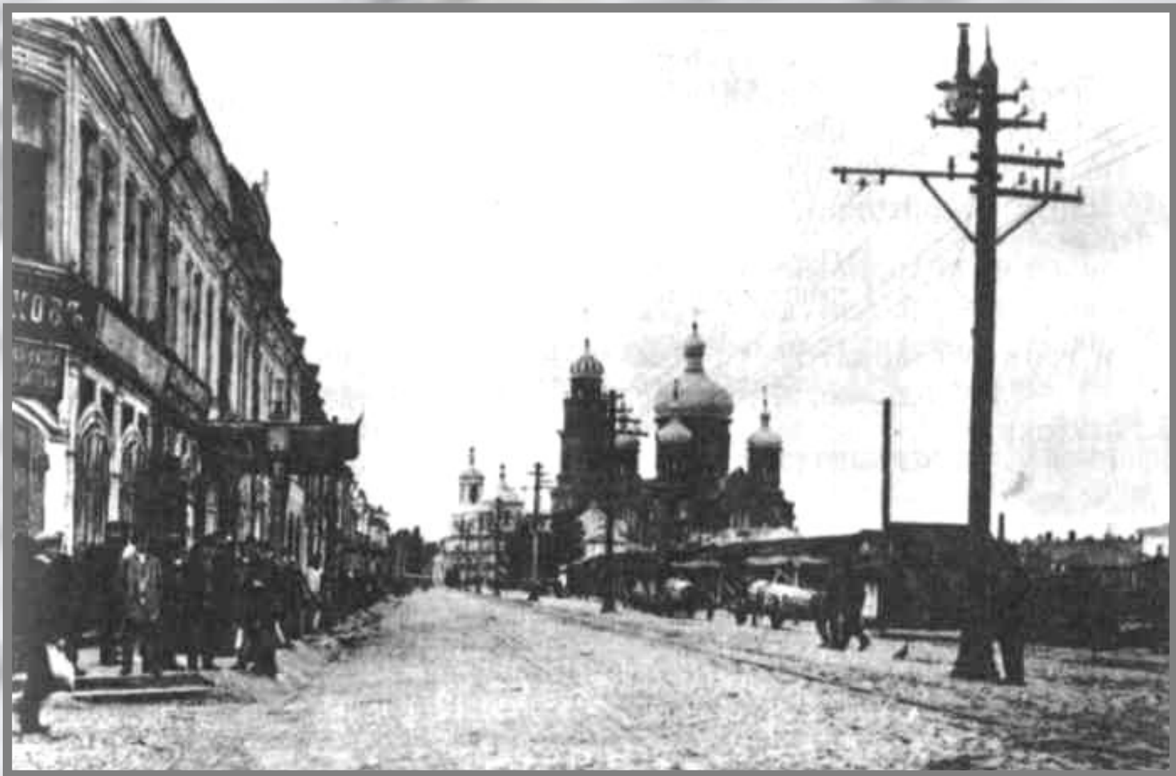
Орёл, Ильинская площадь