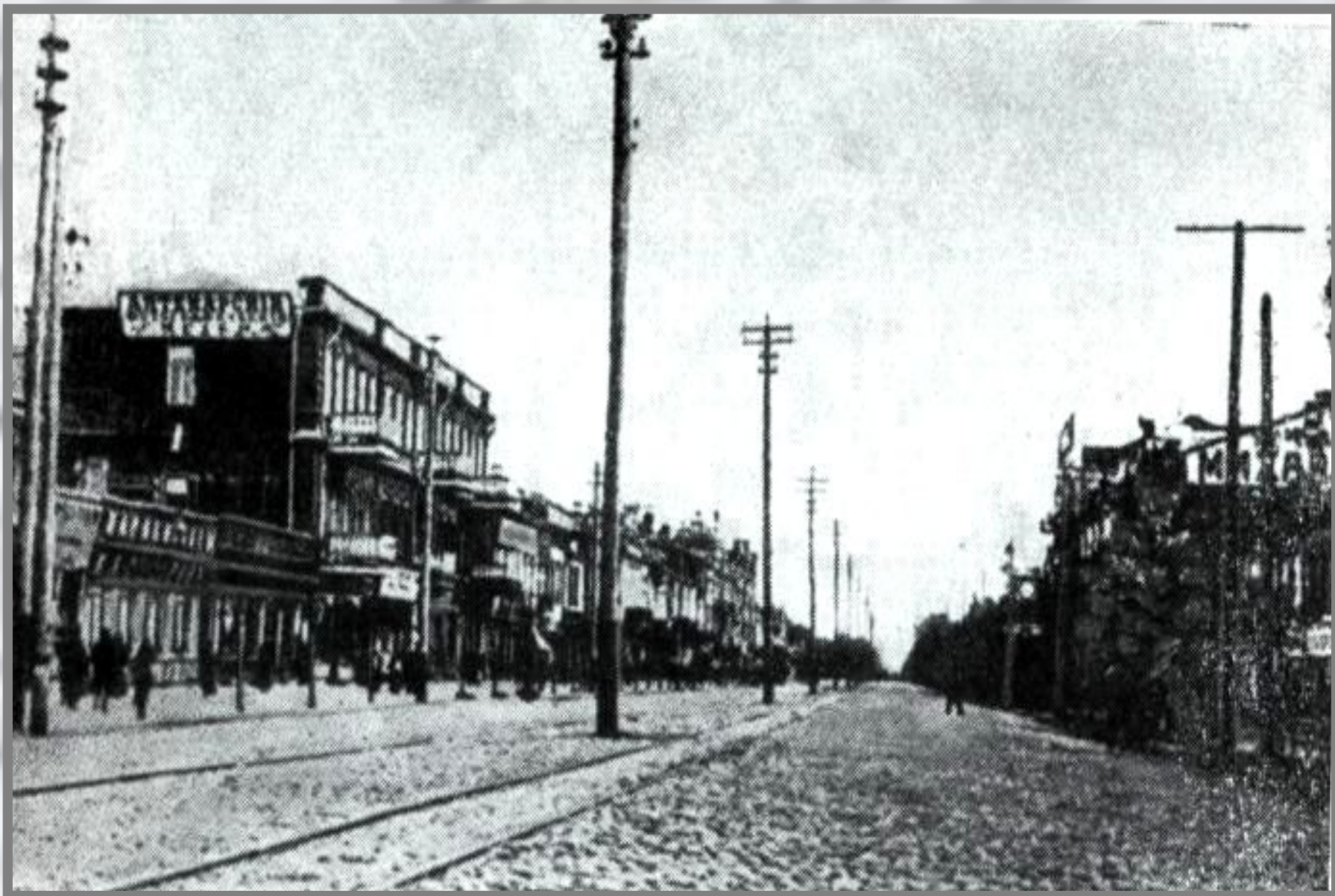
Воронеж, Большая Дворянская – на этой улице родился И.А. Бунин