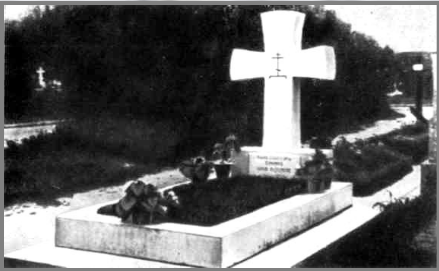
Русское кладбище под Парижем Сент-Женевьев де Буа. Могила Ивана Алексеевича Бунина.