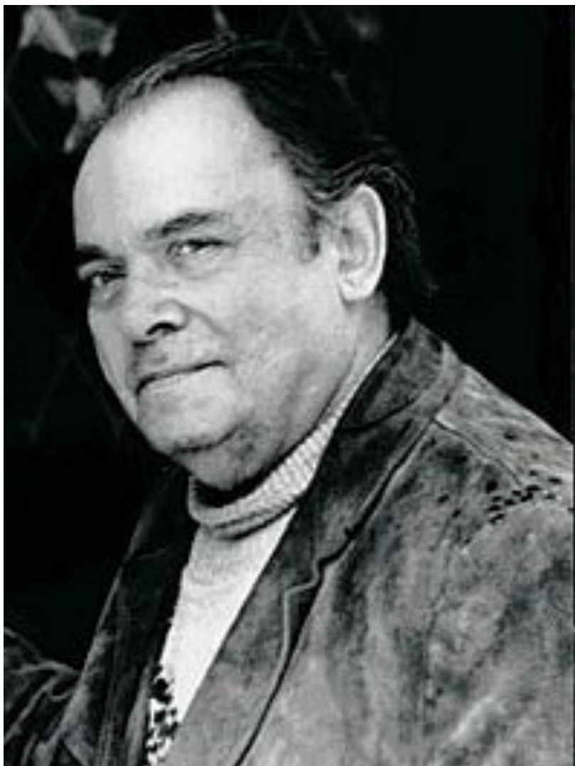
Борис Заходер 1918-2000