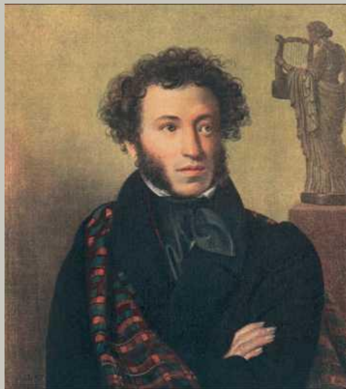
Александр Сергеевич Пушкин 1833г.