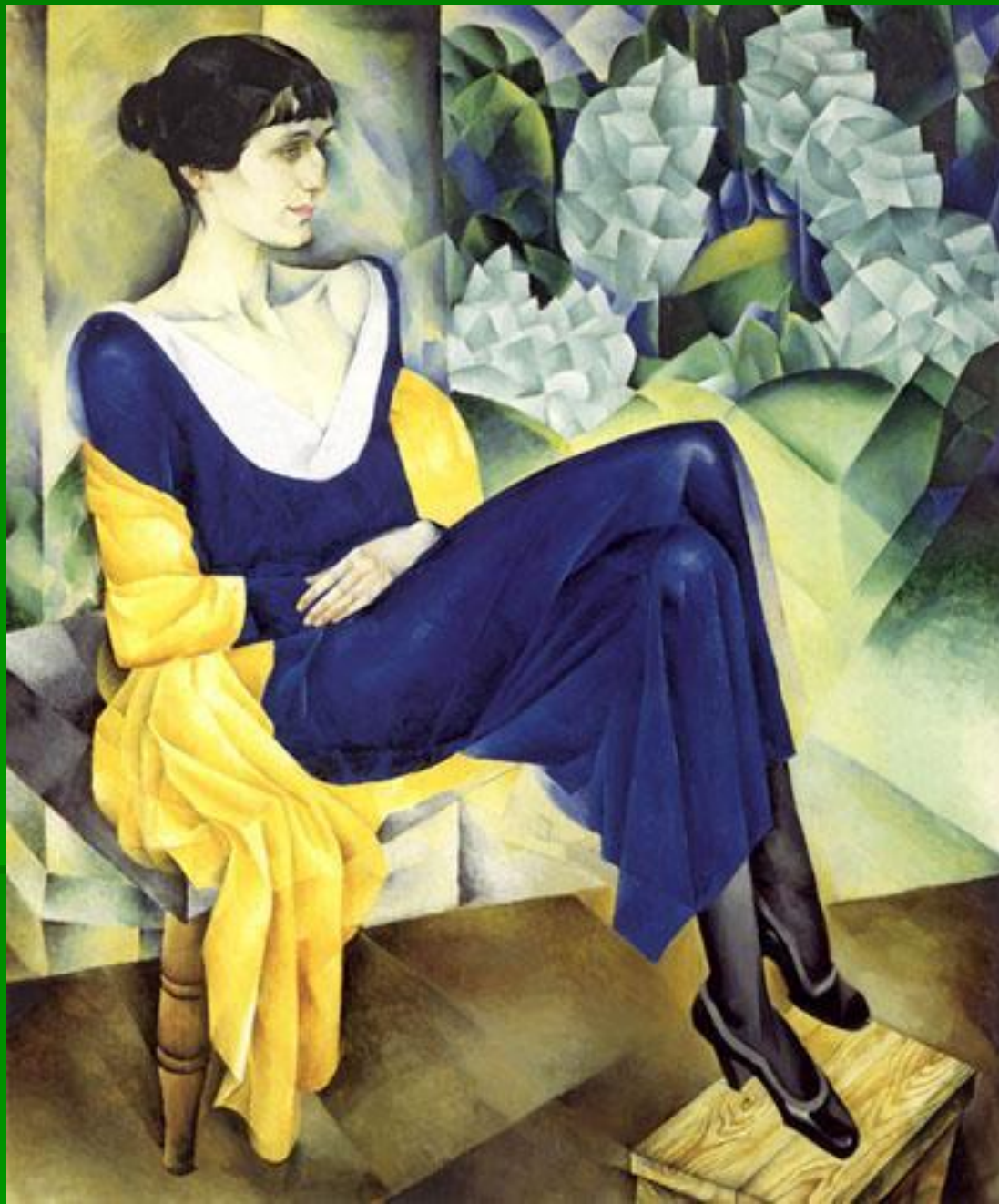
Натан Альтман. Портрет Анны Ахматовой. 1914г. ГРМ