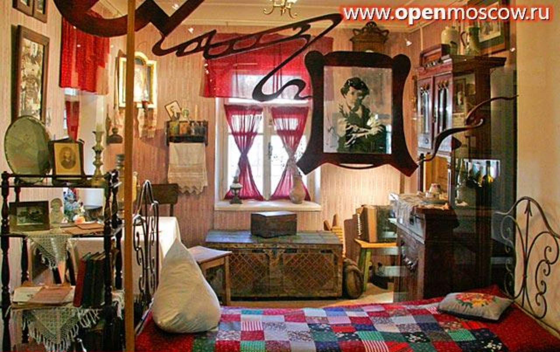
Музей С. А. Есенина Мемориальная комната Большой Строченовский пер., 24, стр. 2, м. "Серпуховская"