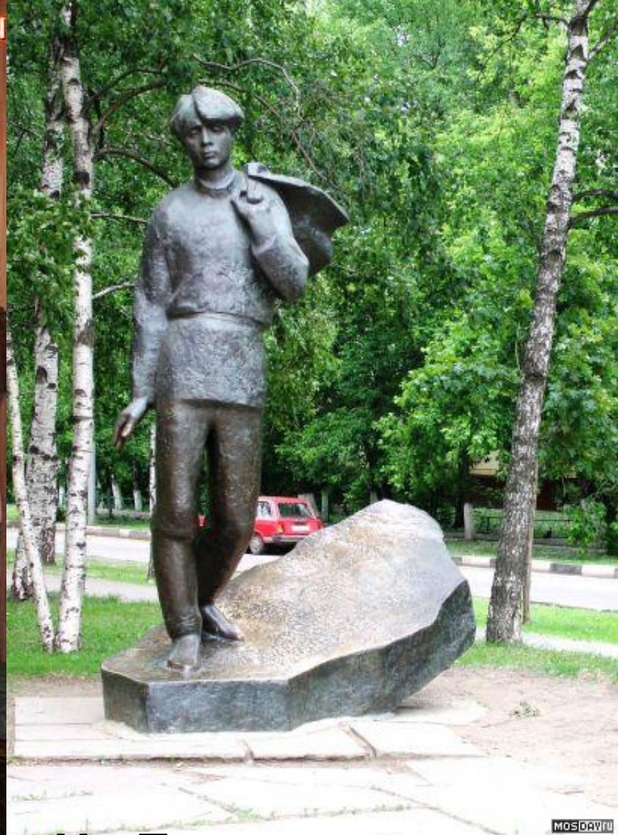
На Есенинском бульваре ( Москва)