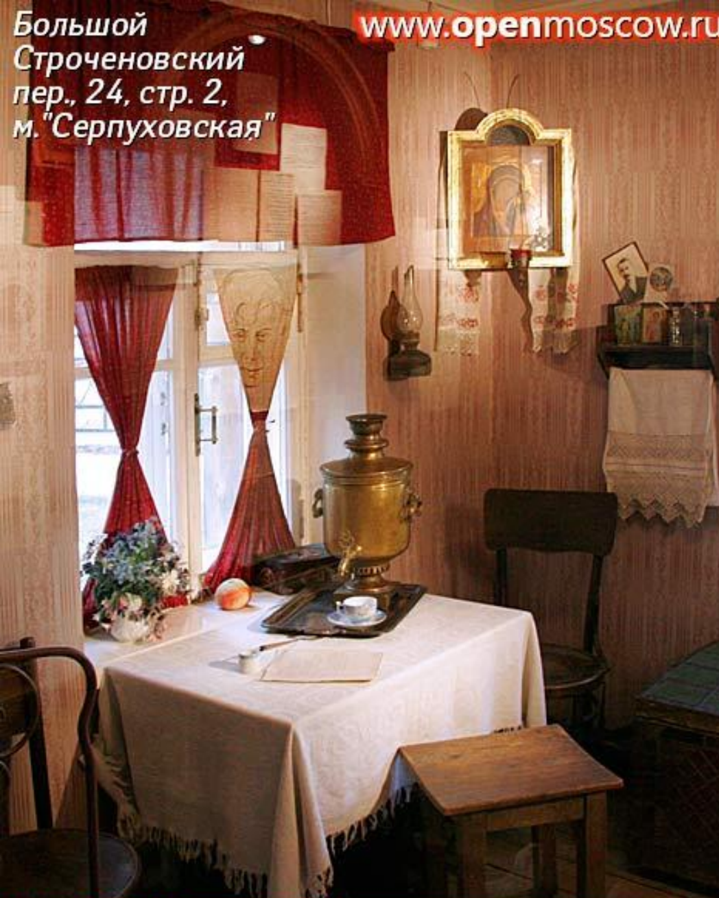
Музей С. А. Есенина Мемориальная комната

Большой Строченовский пер., 24, стр. 2, м. "Серпуховская"