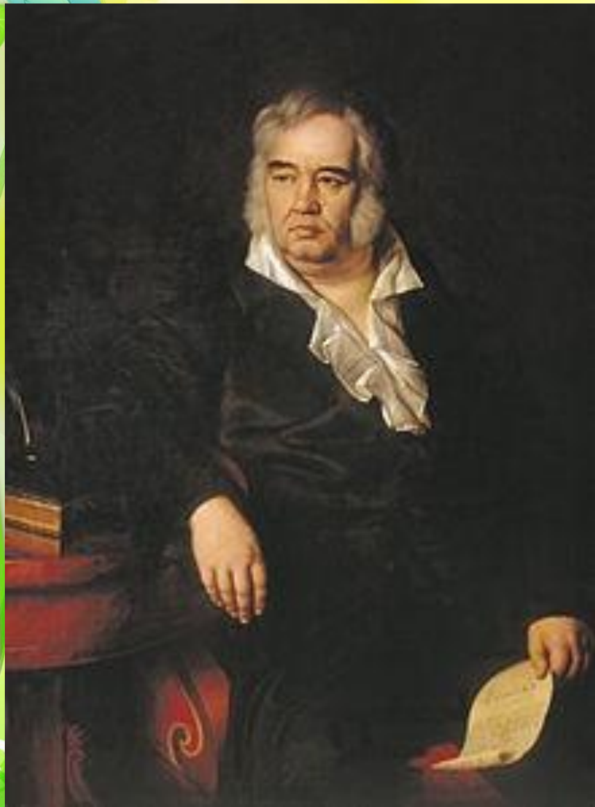
Иван Андреевич Крылов (1769-1844)